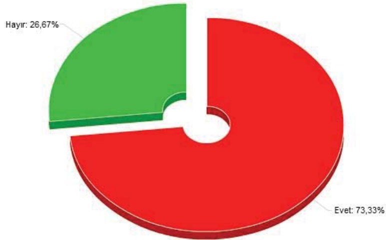
Şekil 3. Lise Mezunu çalışanların, MYO'na gitmesi için destek verme oranı