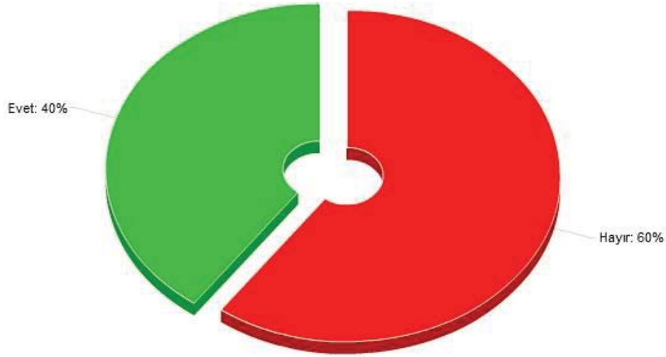
Şekil 5. MYO'daki eğitim ve öğretimin firmanın alanına uygunluğu

Yapılan ankette firmalara meslek yüksekokulları hakkında görüş bildirmeleri de istenmiştir. Firmaların bu konudaki görüşleri “sonuçlar” bölümü içerisinde yer almaktadır.