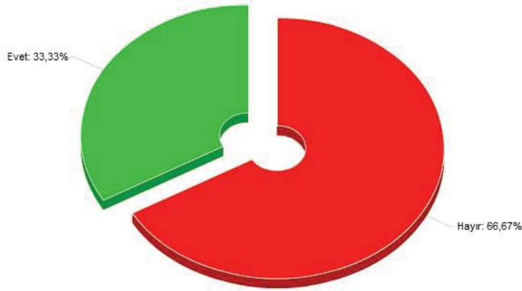
Şekil 1. Üniversitelerin öğretim programlarının hazırlanması sürecine hiç dâhil oldunuz mu?

Şekil 1'de firmaların "Üniversitelerin öğretim programlarının hazırlanması sürecine hiç dâhil oldunuz mu?" sorusuna verdiği cevapta %66 sının üniversitelerin öğretim programlarının hazırlanmasında hiçbir şekilde katkısının olmadığı anlaşılmaktadır. Bu durum meslek yüksekokullarının verdiği eğitimin, kısmen de olsa sektörün katkısı olmadan hazırlandığını göstermektedir. Özellikle ara insan gücü yetiştirmeye yönelik eğitim veren meslek yüksekokullarının mutlaka kendi alanı ile ilgili firmalar ile görüş alışverişinde bulunması ve bunun için bir sistem oluşturulması gerekliliğini göstermektedir.