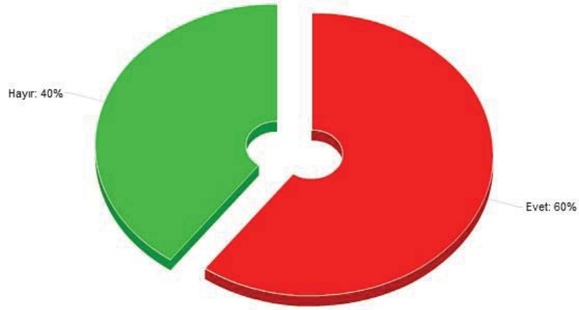
Şekil 2. Firmaların MYO mezunlarına özel bir eğitim kuruluşunda ek olarak eğitim almasını sağlama oranı.