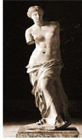
9. Meloslu Aphrodite