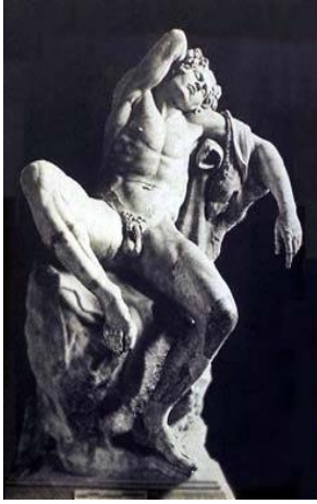
12. Uyuyan Satyr