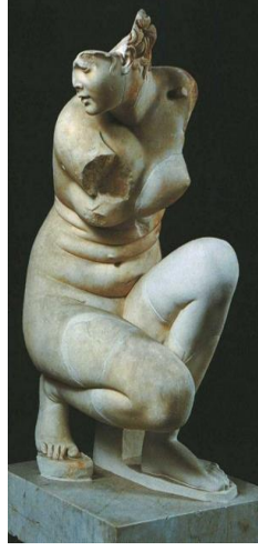
8. Çömelen Aphrodite