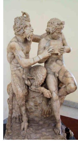
14. Pan ve Daphne