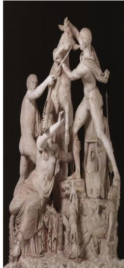
5. Farnese Boğası