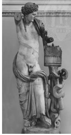
13. Kyrene Apollon