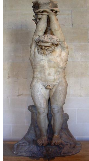
6. Asılan Marsyas