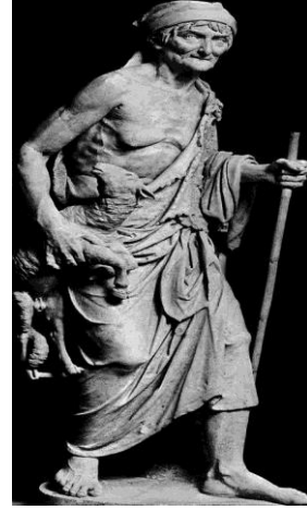
3. Yaşlı Çoban