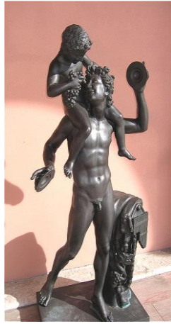
16. Satyr ve Dionysos