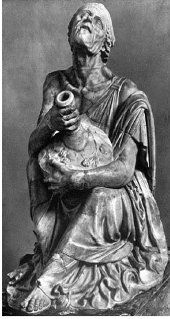
1. Yaşlı Kadın