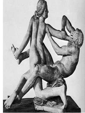
11. Satyr ve Hermaphrodite