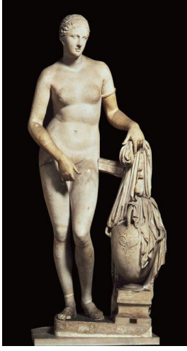
7. Knidoslu Aphrodite