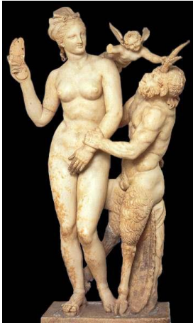
15. Aphrodite, Eros ve Pan