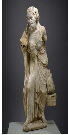
2. Pazarıcı Kadın