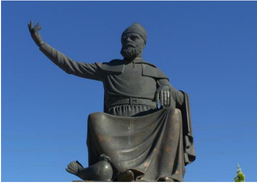
Şekil 2: Hacı Bektaş-i Veli

Hacı Bektaş-i Veli'nin Makalat, Kitabı'l-Fevaid, Şathiyye, Besmele Tesviri isimli eserlerinin olduğu bilinmektedir. Bu eserlerin haricinde Hacı Bektaş-i Veli'nin hayatı ve kerametlerini anlatan Velayetname önemli bir eserdir ( http://www.hacibektaş.bel.tr ).