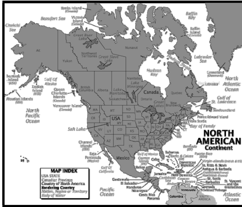
Şekil 3. Kuzey Amerika

Kuzey Amerika kruvaziyer turizmi, Karayipler ve doğu sahillerindeki limanlara doğru en önemli büyümeyi 2000'li yılların başlarında gösterdi. Meksika'dan Güney Kaliforniya bölgesine düzenlenen kruvaziyer turlar, gemi veya yolcu sayısı bakımından Karayiplere rakip olamasa da kruvaziyer turizm endüstrisinin istikrarlı bir pazarı haline gelmiştir. Alaska ise iklim ve coğrafi koşulları bakımından kruvaziyer sektörde sadece Mayıs-Eylül dönemlerinde aktif halde bulunmaktadır. Büyük yolcu gemileri ile küçük kruvaziyer gemileri kruvaziyer sektörünün tüm mevsimlere yayılmasını, sürekli ve sağlıklı bir büyüme olmasını sağlamıştır. Ayrıca bugün dünyanın da en büyük kruvaziyer birlik ve dernekleri aynı coğrafyada kurulmuş, dolayısıyla bölgenin kruvaziyer sektöründeki gelişimi de devam etmiştir. Şekil 3'te görüldüğü gibi Kuzey Amerika Bölgesi, Kanada, Amerika Birleşik Devletleri ve Meksika'yı içine almaktadır.