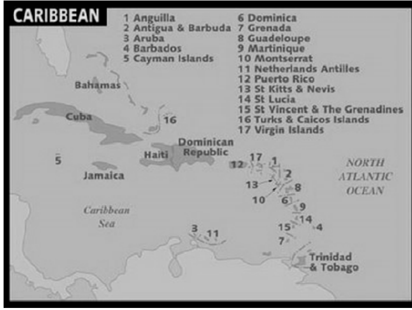
Şekil 1. Karayipler

Aruba, Bahamalar, Barbados, Belize, Bermuda, Bonaire, İngiliz Virgin Adaları, Cayman Adaları, Cuba, Curacao, Dominica, Grenada, Guyana, Dominik Cumhuriyeti, Guadeloupe, Jamaica, Martinique, Montserrat, Puerto Rico, St. Barts, St. Eustatius, St. Kitts, Nevis, St. Lucia, St. Maarten, St. Vincent ve Grenadines, Suriname, Trinidad ve Tobago, Turks ve Caicos, Amerikan Virgin Adaları ve Venezuela'dır. Şekil 1.'de bu adaların gösterildiği Karayipler haritası yer almaktadır.