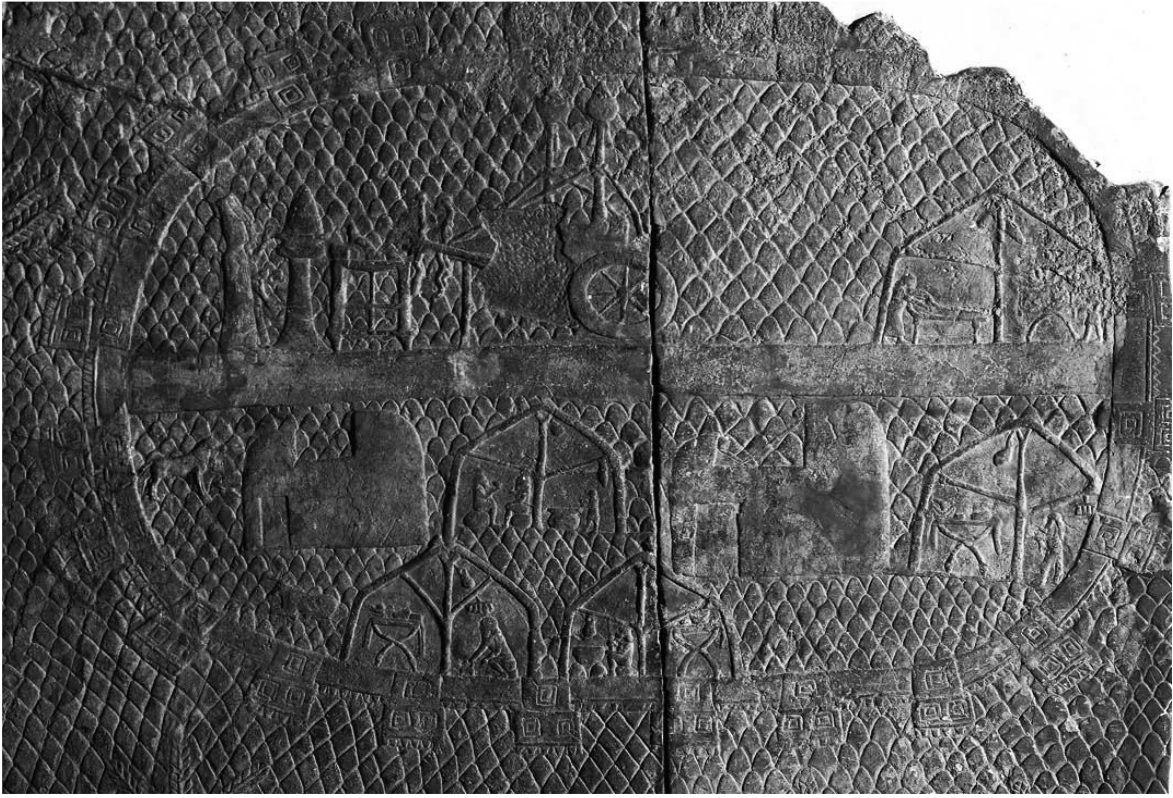
Şekil 3: (Ninova Güney batı sarayı) İlahi sembollerle iki tekerli araba, kurban masası, bir tütsü standının yanında ayakta duran iki din adamı ve çadırlarla bir Asur Takviye kampı (British Müzesi'nden) (Collins, 2014: 625).