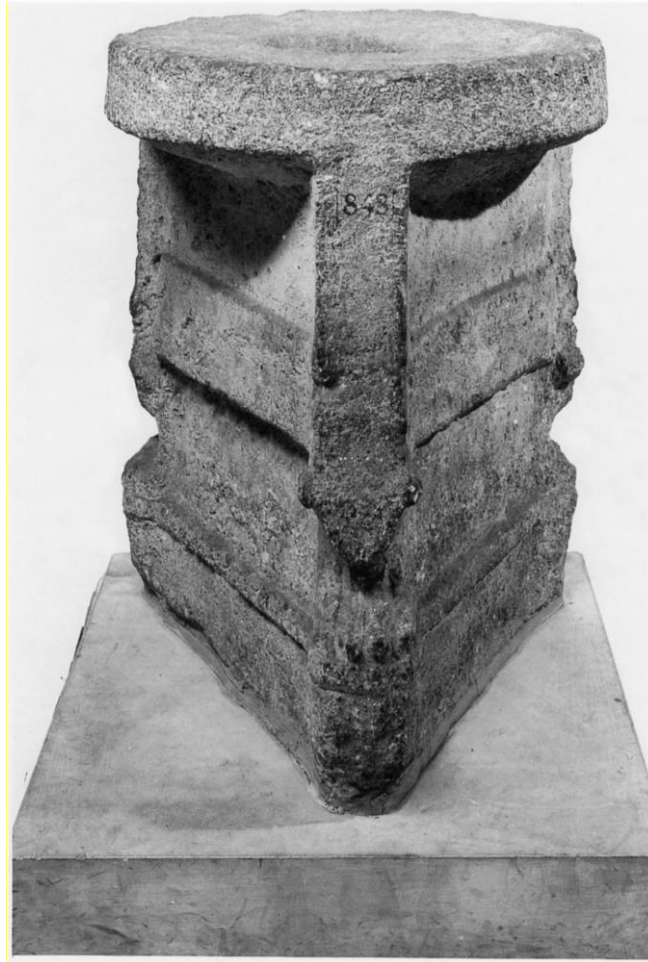
Şekil 1: Ninurta'dan Tütsü Yakmak amacıyla kullanılmak üzere uyarlanmış kireç taşından bir masa (Reade, 2002: 170).

Tütsünün Eski Çağlardan modern zamanlara kadar çok farklı amaçlar için kullanımı devam etmektedir. Eskiçağ toplumları tarafından çeşitli nedenlerle kullanılan tütsü halkımız tarafından kullanılmaya devam etmesine rağmen, bazı uygulamaların günümüzde tamamen terkedildiği görülmektedir. Tütsü kullanımındaki bu farklılıkların özellikle politeist toplumlarla semavi dinlere mensup toplumlar arasındaki inanç farklılıklarından kaynaklandığı anlaşılmaktadır.