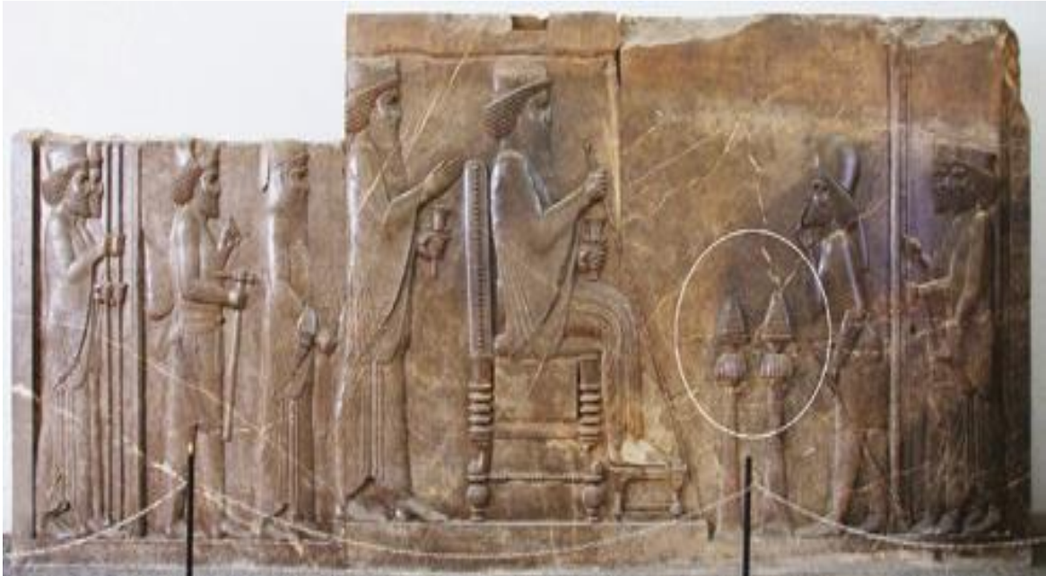
Şekil 4: Pers Kralı I. Darius (MÖ 550-486) iki tütsü yakıcı ile birlikte tahtında otururken gösteren rölyef (Altaweel ve Squitieri, 2018: 166).