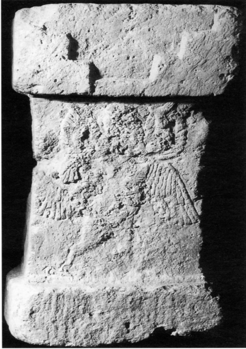
Şekil 2: Ninova'da İstar Tapınağından MÖ VII. Yüzyıla Tarihlenen heykelin üzerinde tütsü yakıldığına dair izler bulunmaktadır (Reade, 2002:151).