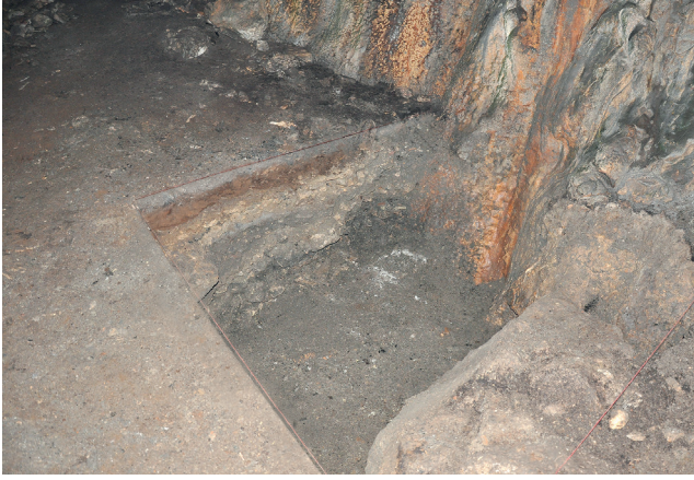
Res. 4. Tavabaşı Aşağı Mağara İçinde Açılan 2,5 x 2 m Boyutlarındaki Sondaj Çukuru / Trial Trench Measuring 2,5 m x 2 m Opened in Lower Cave at Tavabaşı.

300-350 yıl kadar iskan gördüğü söylenebilir. Değişik tabakalarda gözlemlenen seramikler içerisinde yüze yakın tabakalarda az miktarda Neolitik Dönem, Bronz Çağı ve Demir Çağından Bizans Dönemine kadar farklı dönemleri temsil eden çanak çömlek parçaları gözlemlenmiştir. Mağara girişinin hemen üst kısmındaki fresko parçaları da Bizans Dönemi'ne tarihlenmektedir.