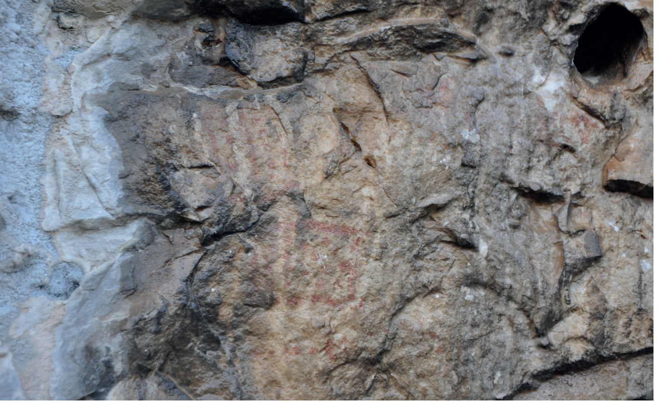
Res. 15. Tavabaşı Aşağı Mağara Cephesindeki 3 Numaralı Resim Kümesi: Mimari Betimlemeler / Architectural Narrative in Group 3 on the Façade of Lower Cave.