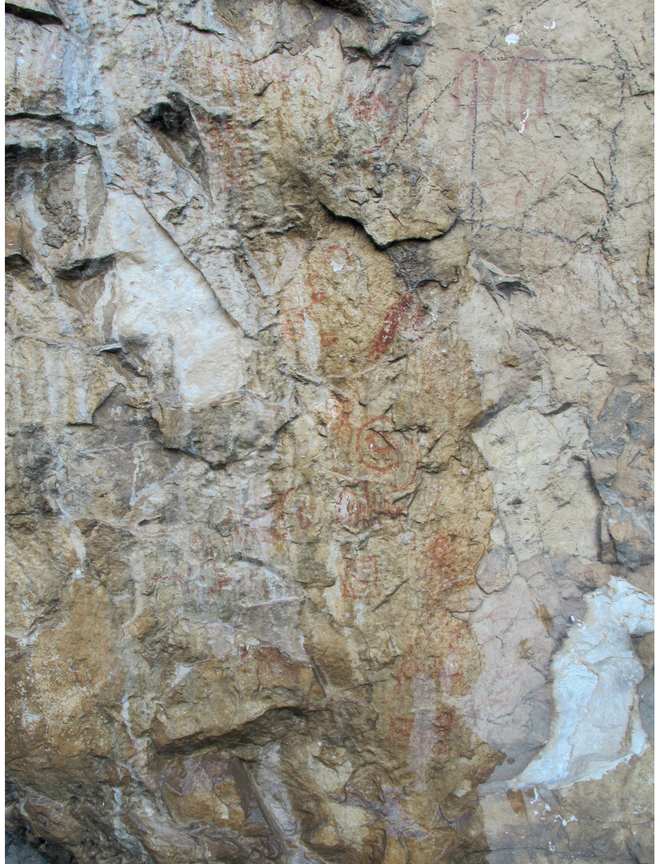
Res. 17. Tavabaşı Aşağı Mağara Cephesindeki 5 Numaralı Resim Kümesi: Soyut Resimler / Abstract Figures in Group 5 on the Façade of Lower Cave.

rastlanılır ve bu betimlemeler genel olarak soyut ve fantastik anlatımlar olarak yorumlanmaktadır. Tavabaşı kaya resimleri içerisinde sıkça tasvir edilen bir başka soyut figür, düz bir çizginin karşılıklı iki tarafına kısa çizgiler atılarak oluşturulan “tarak” formuna benzer motiftir. 3, 4, 5 ve 7 numaralı resim kümeleri içerisinde tercih edilen bu motif çoğunlukla bağımsız olarak tasvir edilmiş olmasına rağmen, beşinci küme içerisinde olduğu gibi spiral betimlemeleriyle bağlantılı olarak da kullanılmıştır. Farklı kümeler içerisinde bu motifin yatay, çapraz ya da dikey konumlarda yerleştirilmiş olması da dikkat çekicidir. Özellikle yedinci küme içerisinde yer alan örnek diğer benzerlerinden boyutu ve