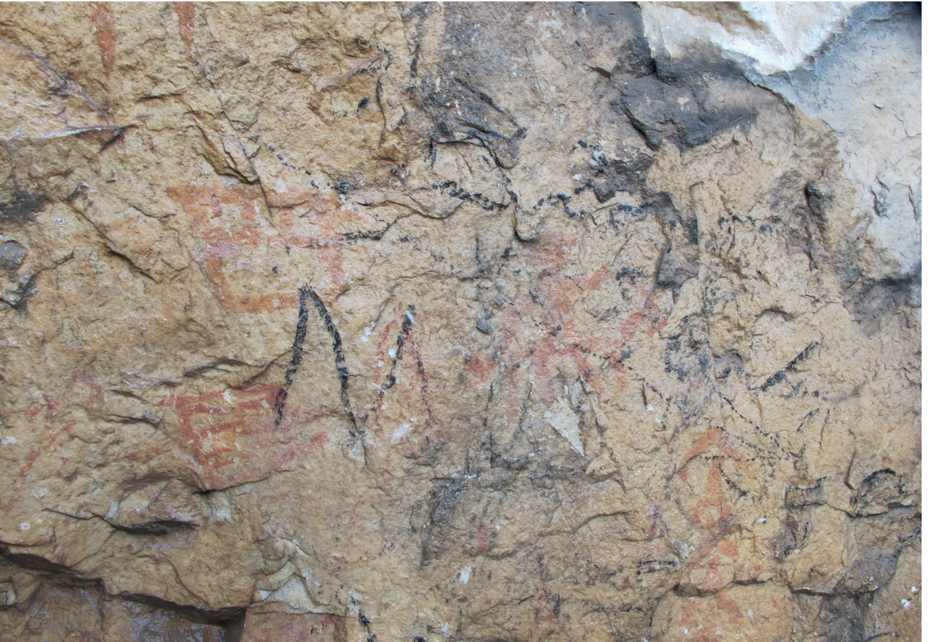
Res. 16. Tavabaşı Aşağı Mağara Cephesindeki 6 Numaralı Resim Kümesi: Mimari Betimlemeler / Architectural Narrative in Group 6 on the Façade of Lower Cave.