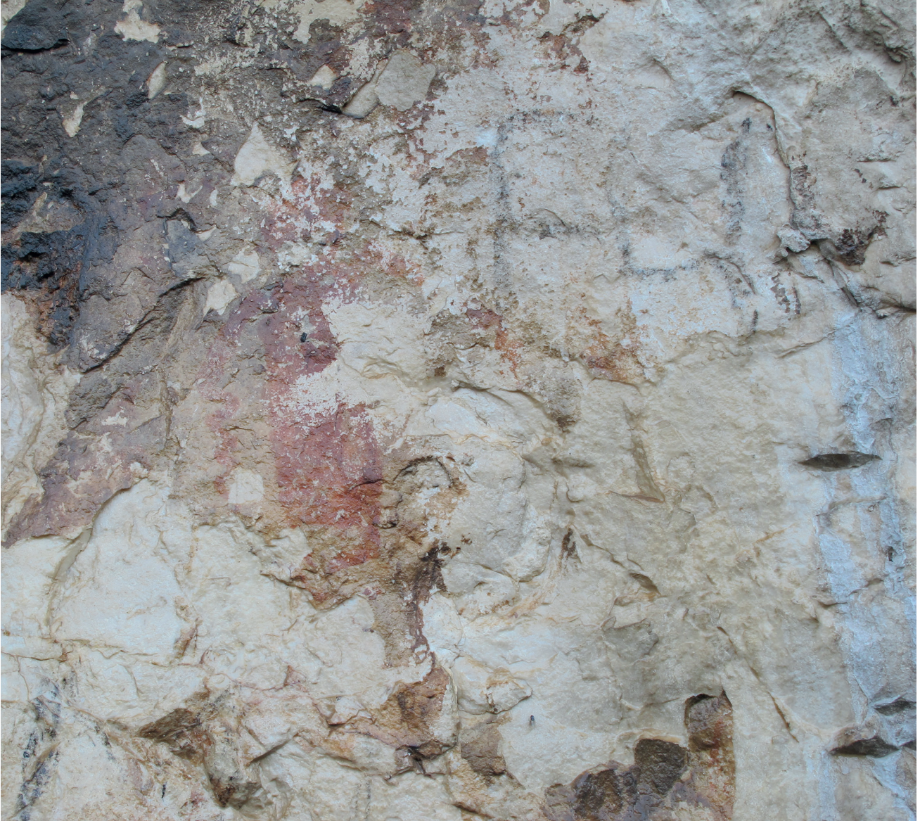
Res. 10. Tavabaşı Aşağı Mağara Cephesindeki 8. Resim Kümesi: Yalnız İnsan Tasvirleri / Human Figures in Group 8 on the Façade of Lower Cave.