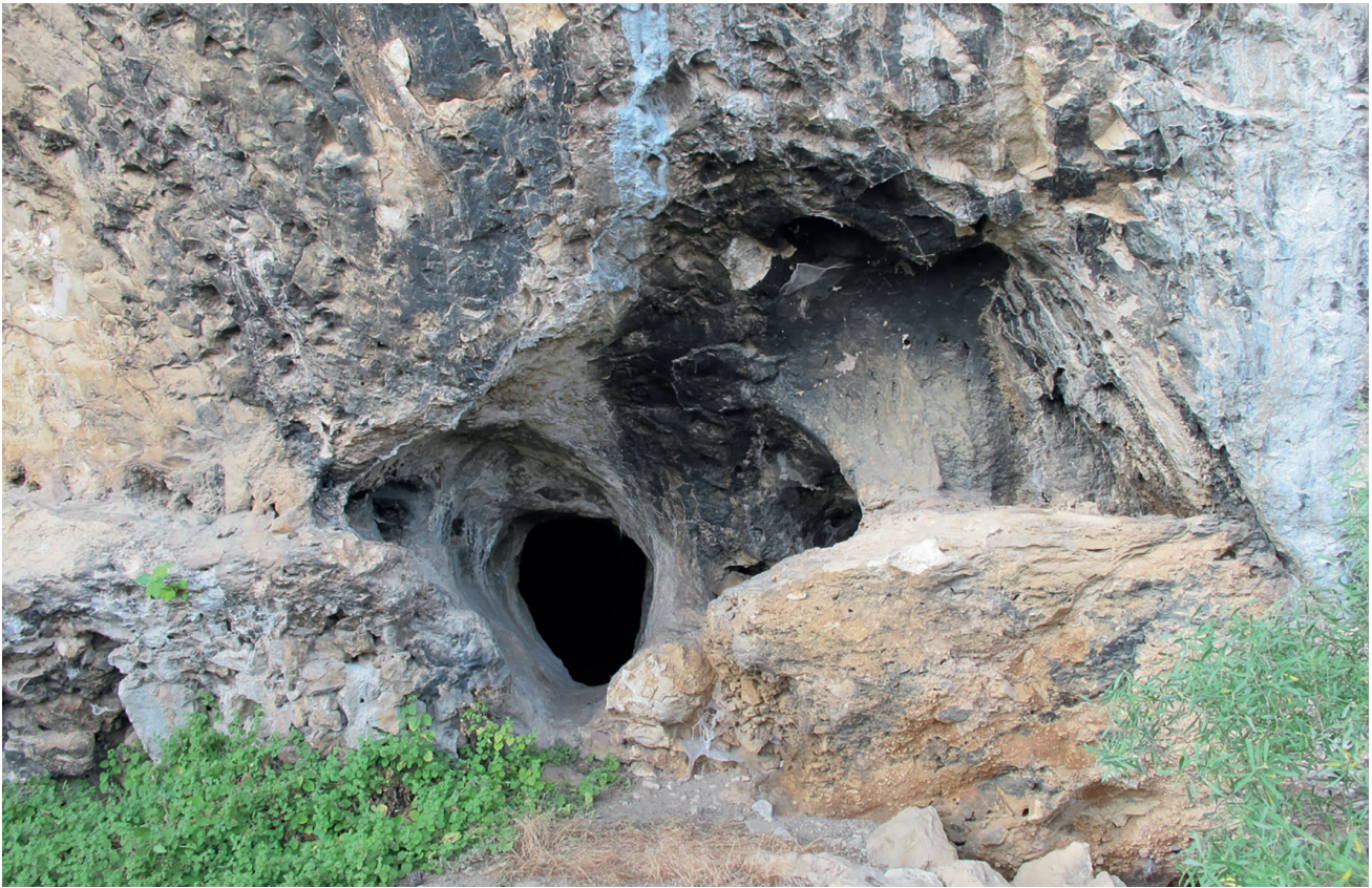
Res. 3. Tavabaşı Aşağı Mağara girişi / Entry of Lower Cave at Tavabaşı.

Aşağı Mağara ise Yukarı Mağara'ya göre kayalık yüzeyin bir alt kodunda yer almaktadır (Res. 3). Yukarı Mağara'ya göre daha küçük ve 9 metre uzunluğunda ve 6 metre genişliğinde tek bir odadan oluşan Aşağı Mağara'ya 1,2 x 0,6 m ölçülerinde küçük bir açıklıktan girilmektedir. Mağaranın zemininde kaçak kazıcıların açtığı çukurda yapılan tespit ve belgeleme çalışmaları esnasında farklı yerleşim katmanlarına ulaşılmıştır (Res. 4). Yüzeyden yaklaşık olarak 1,5 m derinlikte ana kayaya ulaşan açmanın kaya üzerindeki 0,6 m kalınlığında kültür tabakasında yoğun miktarda Orta Kalkolitik döneme ait buluntular ortaya çıkarılmıştır. Söz konusu yerleşim tabakası alt ve üstten genellikle karbon birikimi ile diğerlerinden ayrılmıştır. Söz konusu Orta Kalkolitik dönem tabakasından alınan iki örneğin radyokarbon tarihlemesi sonucu bu tabakanın MÖ 4838 ve 4459 arası yaklaşık