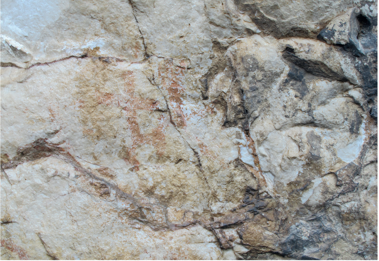
Res. 13. Tavabaşı Aşağı Mağara Cephesindeki 9. Resim Kümesi: Yalnız İnsan Tasvirleri / Human Figures in Group 9 on the Façade of Lower Cave.

Sekiz numaralı küme içerisinde yer alan ve yüksek tutulmuş boyutuyla diğerlerinden ayrılan figür belirgin kafa yapısı, iri betimlenmiş gövdesi, yanlara açılan yay biçimli kolları ve ellerinde tuttuğu spiral formlu sembollerle (yılan?) diğer insan betimlemelerinden ayrılmaktadır (Res. 10). Erkek anlatımları olarak yorumlanan diğer resimlerden belirgin biçimde ayrılan bu figürün bir kadın betimlemesi olması olasılığı yüksektir. Ayrıca figürün boyutunun diğer örneklerden daha büyük tutulması ve konum olarak da resim kompozisyonunun en sağında yer alarak diğer anlatımlara yönlendirilmesi tanrısal bir karakterde olmasıyla açıklanabilir. Diğer yandan özellikle altıncı kümeden sonra betimlenmiş insan ve insan-hayvan anlatımlarının bu figüre doğru yönlendirilmiş olmaları da oldukça dikkat çekicidir.