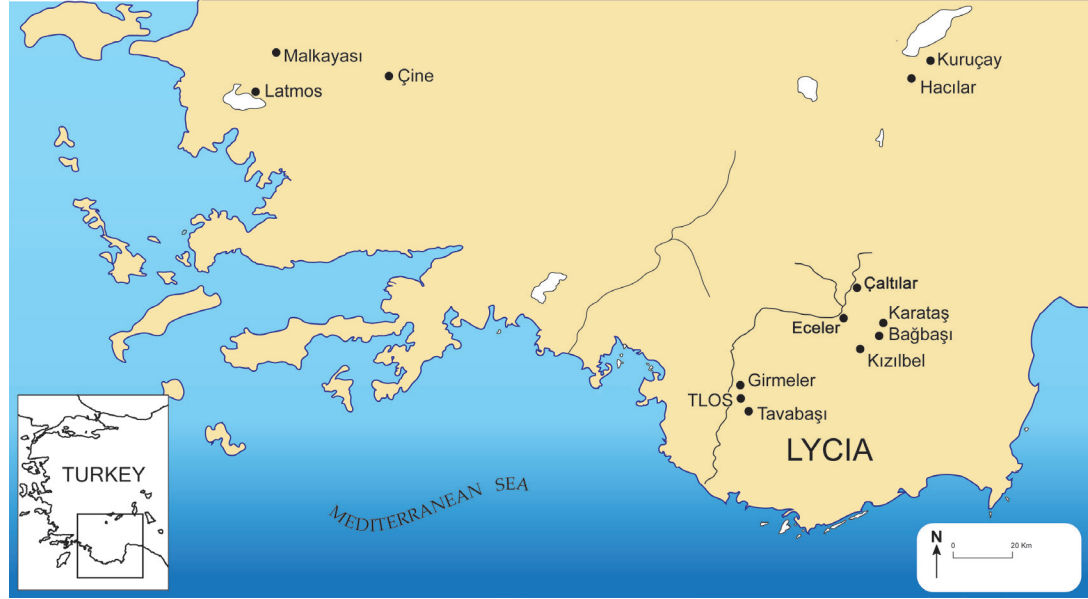
Res. 1. Likya Bölgesi Prehistorik Yerleşim Alanları / Map Showing Major Prehistoric Sites in South-West Anatolia.

Tlos arkeolojik kazıları kapsamında kentin territoryasında da bölgenin antik çağ kültürlerine yönelik önemli araştırmalar gerçekleştirilmiştir. Tlos'un Geç Tunç Çağı Hitit kaynaklarında Tlawa olarak adı geçen bir kaç kentten birisi olması bu araştırmaların altında yatan ana nedenlerden birisi olmuştur. Tlos çevresinde olası MÖ 2. Binyıl buluntulara ait izleri tespit etmeyi amaçlayan çalışmalar esnasında bölgenin Tunç Çağı, Kalkolitik ve Neolitik Dönemlerine ait önemli verilere ulaşılmıştır. Bu yerleşimlerden en önemlisi hiç şüphesiz Erken Neolitik Dönemden Bronz Çağına kadar iskan izleri sunan Girmeler Mağarası önündeki bugün tahrip olmuş höyük yerleşimi kalıntılarıdır 2 . Tlos kazı ekibi tarafından gerçekleştirilen yüzey araştırmalarında ortaya çıkan en dikkat çekici keşiflerden birisi de Arsaköy yakınlarında Tavabaşı Mevkii'ndeki iki mağaradır 3 . Bunlardan Aşağı Mağara'ya girişi sağlayan küçük açıklığın üzerinde ve solunda aşınmış düz yüzey üzerinde kırmızı boya ile yapılmış farklı biçimlerde geometrik motifler, süslemeler, insan figürleri ve tanımlanamayan figürler dikkat çekmektedir. Üslup bakımından burada karşımıza çıkan kırmızı boyalı figürlerin çok yakın benzerlerini kuzeybatıda Latmos Dağlarında bulunan birçok kaya resimlerinden bilmekteyiz. Şimdiye kadar Latmos Dağları kaya resimlerinin Batı Anadolu kaya resim sanatının tek tanığı olarak kabul edilmekteydi. Tavabaşı Aşağı Mağara artık