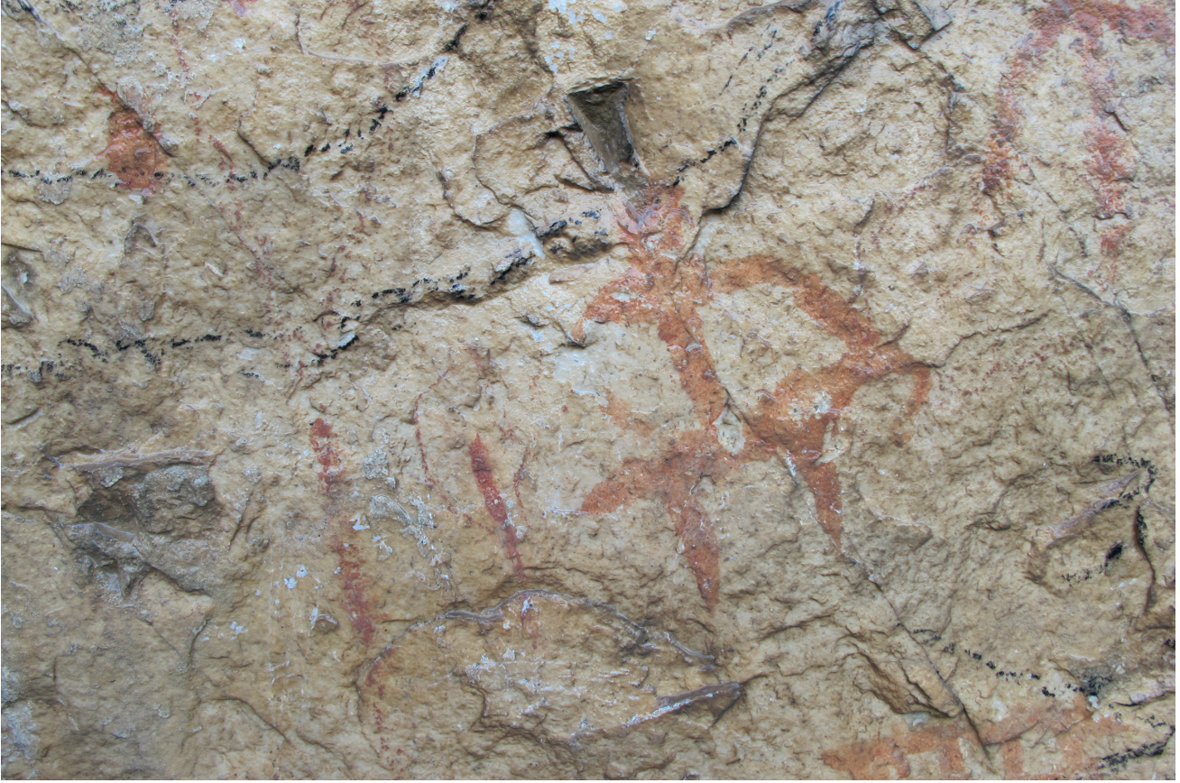
Res. 11. Tavabaşı Aşağı Mağara Cephesindeki 6 Numaralı Resim Kümesinde İnsan Figürü / Human Figure in Group 6 on the Façade of Lower Cave.