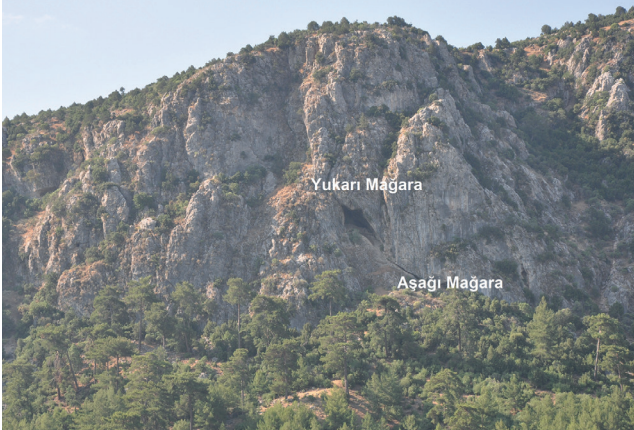
Res. 2. Arsaköy yakınlarındaki Tavabaşı Mağaraları Genel Görünüm / View of Upper Cave and Lower Cave at Tavabaşı near Arsaköy.

Yaklaşık olarak 19 metre eninde geniş bir girişe sahip Yukarı Mağara'nın girişinin önünde bulunan büyük kaya kütlelerindeki çökme ve kopmalardan dolayı buraya ulaşım zaman içinde zorlaşmıştır. Mağara girişinin hemen batı yönündeki kayalığın önünde yer alan iki adet Erken Bizans Dönemi sarnıcın varlığından, girişteki göçüklerin günümüzden en az bin yıl önce gerçekleştiği düşünülmektedir. Mağara önündeki kaya kütlelerinin kopmasının ardından mağaranın kullanımı sona ermiş olmalıdır. Oldukça kalın sıvalarla yalıtılmış olan sarnıçlardan ilki yaklaşık 2,8 m, ikincisi ise 2 m çapında oval plan göste-