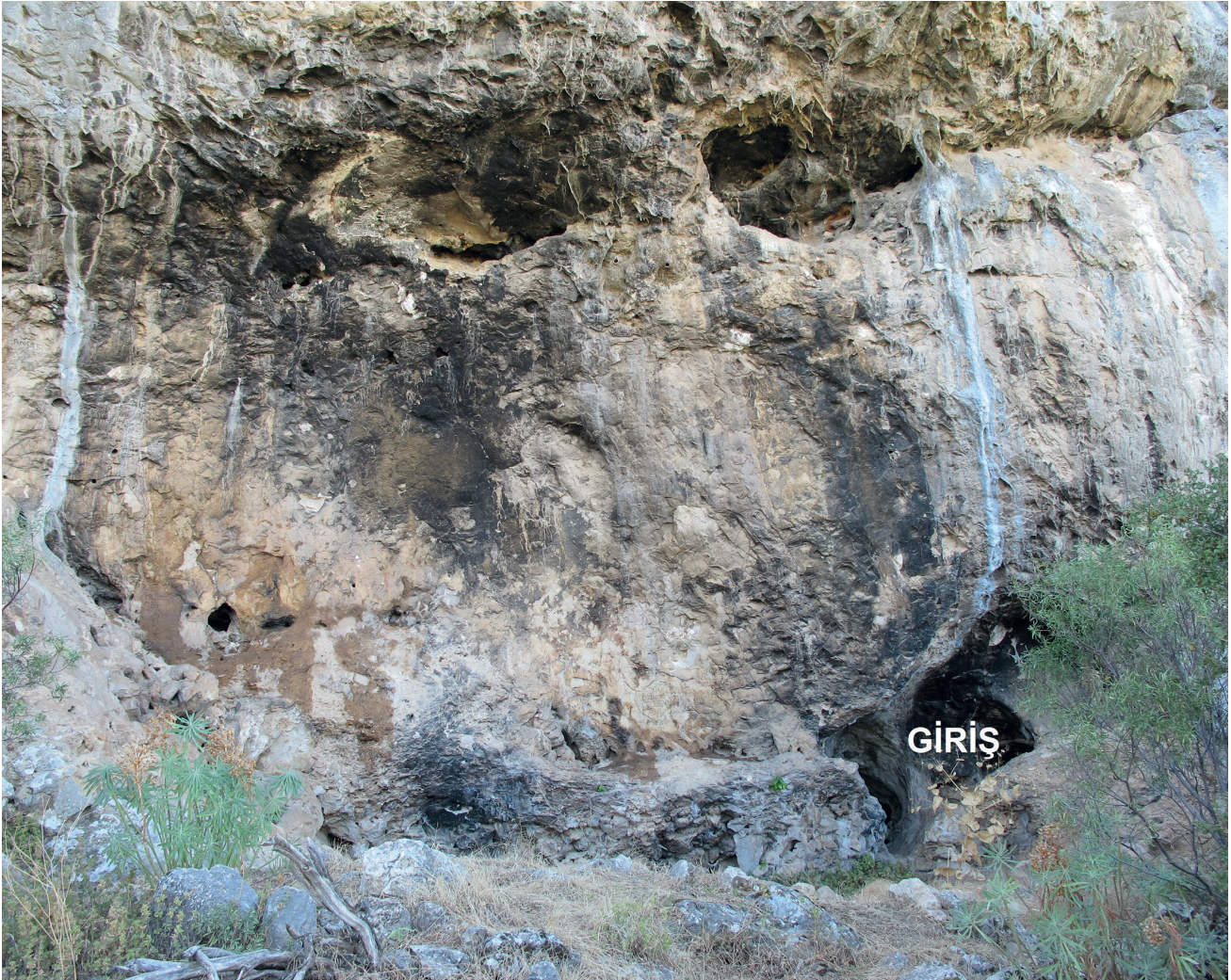
Res. 6. Tavabaşı Aşağı Mağara Girişi ve Aşınmış Düz Yüzeye Sahip Ön Cephesi / Façade of the Lower Cave with Rock Paintings at Tavabaşı.

dığı alanlarda gri gibi daha açık tonların da kullanıldığı tahmin edilmektedir. Tahribata rağmen genel hatlarıyla takip edilebilir durumdaki kaya resimleri içerik olarak kısmen de olsa çözümlenebilmesine olanak sağlamıştır (Res. 7-9). Kaya yüzeyine yerleştirilme durumları göz önünde bulundurularak dokuz farklı küme içerisinde değerlendirilen kaya resimleri başlangıç grubundan itibaren sırasıyla doğal peyzaj, mekan, soyut anlatımlar, insan ve hayvan anlatımlarını içermektedir. Ayrıca ikonografik olarak anlaşılır durumda olan bu konuların yanında tam olarak tanımlanamayan soyut ve düzensiz çizgisel anlatımlar da bu kümeler içerisinde yer almaktadır. Söz konusu resimsel anlatımlar içerisinde bir konu birlikteliği saptamak güçtür. Ancak özellikle altıncı kümeden sonra başlayan insan betimlemelerinin olduğu alanların mekan ve hayvan figürleri ile birlikte resmedilişi göz önünde bulundurulduğunda, bu tasvirlerin günlük yaşama dair bazı anlatımları içerdiğini söylemek mümkündür. Ayrıca sekizinci resim kümesi içerisindeki sahenin en sonunda yer alan, boyut ve biçem olarak diğer insan resimlerinden rahatlıkla ayrılabilen figürün de tanrısal bir karakteri temsil edebileceği düşünülmektedir (Res. 10).