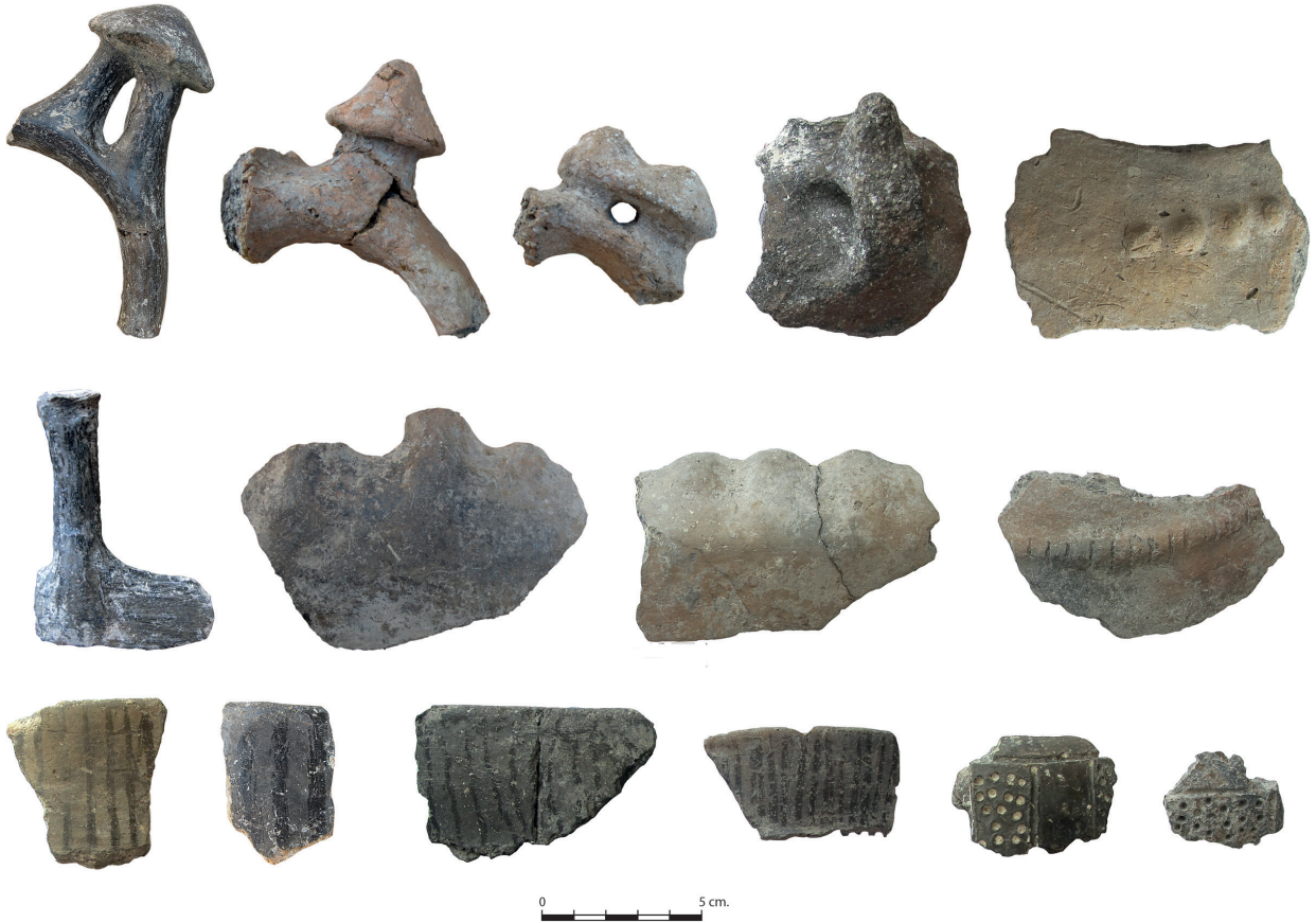
Res. 5. Tavabaşı Aşağı Mağara Orta Kalkolitik Dönem Seramik Buluntuları / Middle Chalcolithic potsherds from Lower Cave at Tavabaşı.

Demir Çağ öncesi Likya kültür tarihi için büyük önem arz eden Tavabaşı mağaraları Batı Anadolu arkeolojisinin en az bilinen dönemlerinden biri olan Orta Kalkolitik Dönem yerleşim izlerini de barındırmaktadır. Güneybatı Anadolu'da söz konusu Orta Kalkolitik Dönem yalnızca Karain Mağarası ile Elmalı ovasında Aşağı Bağbaşı ve Kızılbilbel gibi yerleşimlerden bilinmektedir 7 . Özellikle Aşağı Mağara'nın kesitlerinden alınan radyokarbon örnekleri de bu dönemin aydınlatılması için önemli veriler sunmaktadır. Mağara içerisinde tespit edilen prehistorik çanak çömlek arasında Orta Kalkolitik Döneme tarihlenen örnekler yüksek bir orandadır (Res. 5). Bilindiği üzere Batı Anadolu'da az bilinen Orta Kalkolitik Dönem, Göller Bölgesi Hacılar çok renkli seramik geleneği ile tanımlanan nitelikli Erken Kalkolitik kültür ile daha çok Beycesultan erken evreleriyle özdeş tutulan ve genellikle koyu renkli seramik geleneği ile temsil edilen Geç Kalkolitik kültür arasındaki geçiş dönemidir. Elmalı Ovasında belirlenen söz konusu Orta Kalkolitik Dönem ile ilgili bilgilere Tavabaşı Aşağı Mağara'nın katkısı sağlaması bu bakımdan önemlidir. Genellikle kısa dönemli iskanlar ile karakterize edilen Orta Kalkolitik Dönem yerleşim tipleri arasında Tavabaşı örneğinde olduğu gibi mağara tipi yerleşimlerin yer alması da ayrıca ilgi çekicidir.