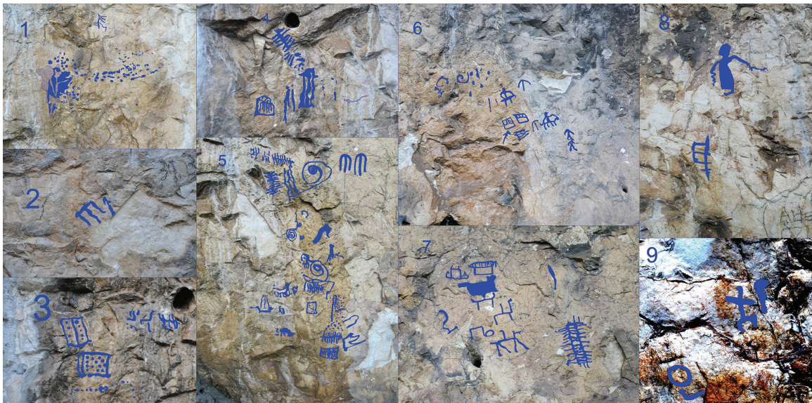
Res. 9. Tavabaşı Aşağı Mağara Cephesindeki Kaya Resimlerinin Renklendirilmiş Hali / Computer-Based Coloring of Rock Paintings on the Façade of Lower Cave.