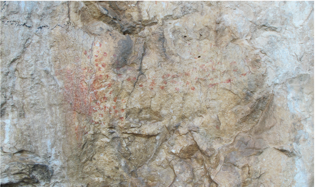
Res. 14. Tavabaşı Aşağı Mağara Cephesindeki 1 Numaralı Resim Kümesi: Doğal Peyzaj Anlatımı / Landscape Narrative in Group 1 on the Façade of Lower Cave.