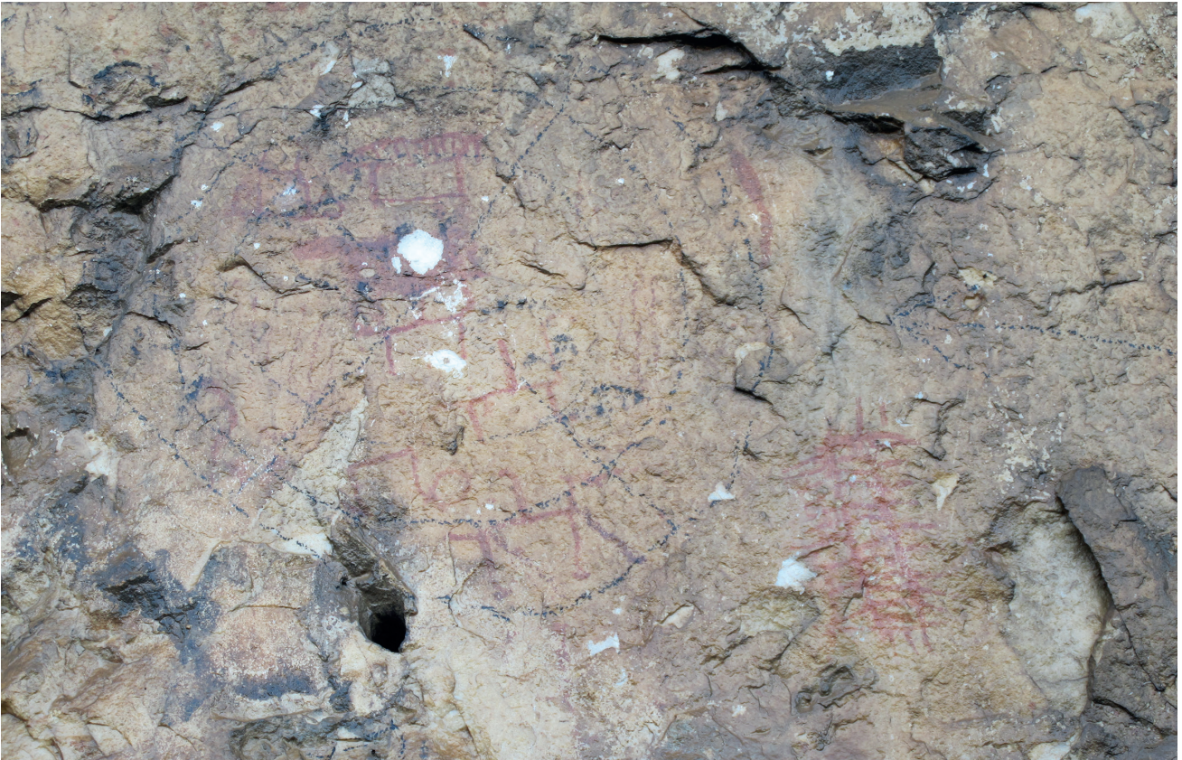
Res. 12. Tavabaşı Aşağı Mağara Cephesindeki 7. Resim Kümesi: Grup Halinde İnsan Tasvirleri ve Hayvan Figürleri / Human and Animal Figures in Groups in Group 7 on the Façade of Lower Cave.