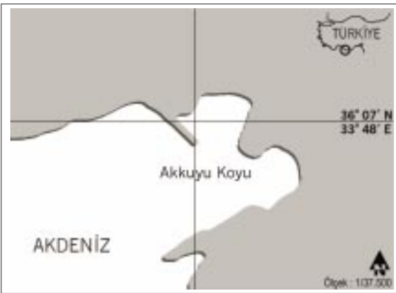
Şekil 1. Akkuyu Koyu /İçel-Türkiye (Harita çizim O. Bahadır Çapar).