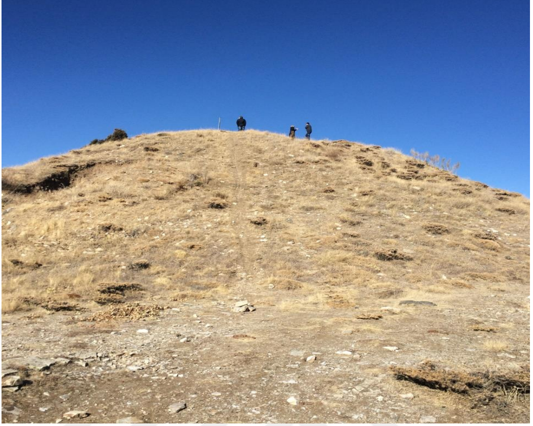
Foto. 41: Sıkdoruk Koruluğunda Üstünde Yer Alan Anıt Mezar Niteliği Taşıyan Höyük (Tümülüs) (25.11.2016)