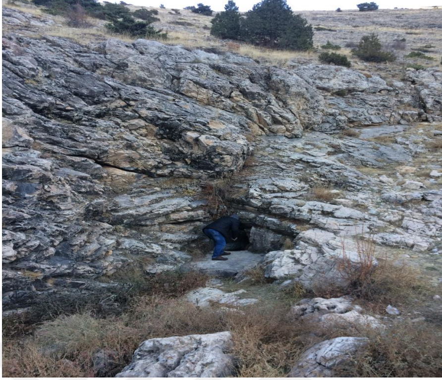
Foto.44 : Hacet Pınarı /Suyu (25.11.2016)