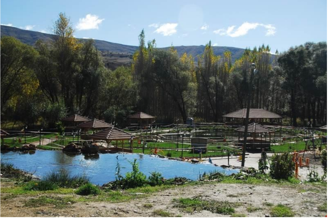
Foto-5: Çayıralan Kaynarpınar Mesire Alanı (Çayıralan/ Ağustos 2017)