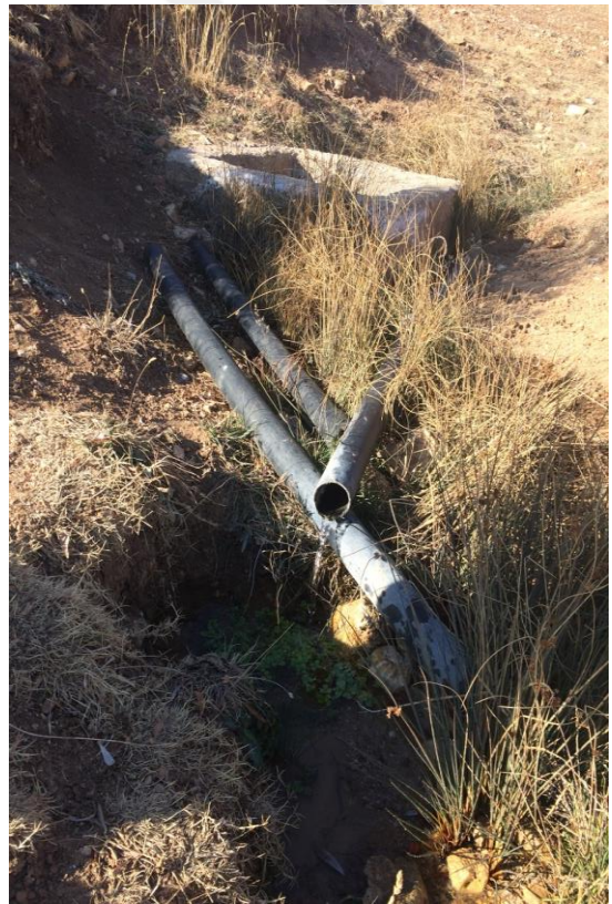
Foto.28-29: Gürpınar Köyü Şeker Pınarı ve Kaynağı (22.10.2016)