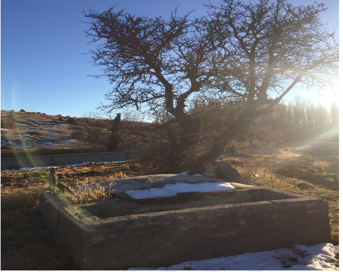
Foto.39: Dede Yanı Mezarı ve Kutsal Sayılan Ardıç Ağacı (20.10.2016)