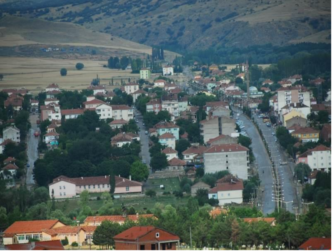
Foto-4: Çayıralan Doğu Girişi Genel Görünüm (Çayıralan/ Ekim 2017)