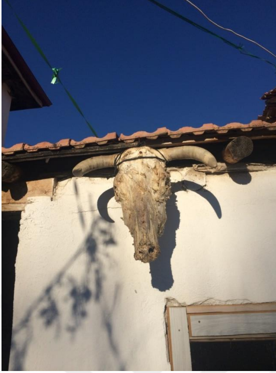
Foto.26: Ahır Üstüne Asılmış İnek Kafası (23.10.2016)