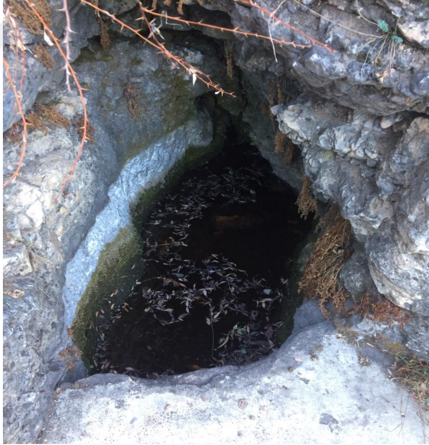
Foto.45: Hacet Pınarı'nın Kaynağı (25.11.2016)