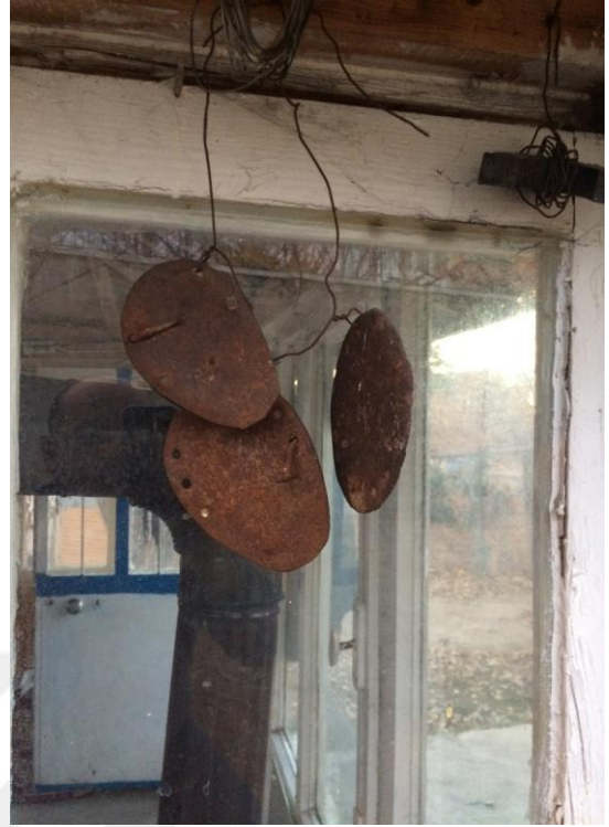
Foto.27: Eşek Nalı (13.10.2016)