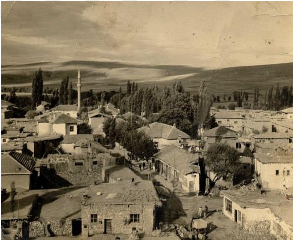
Foto.2: Çayıralan'ın 1921 Yılında Çekilmiş Görüntüsü. (09.02.2018) 68