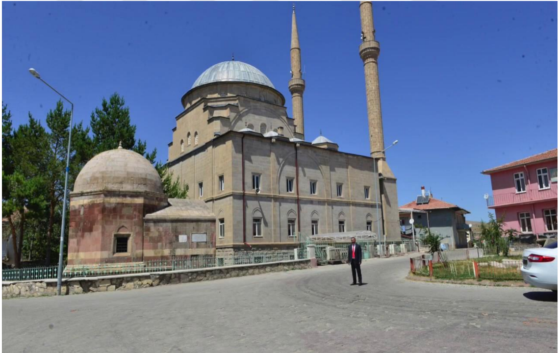
Foto-8: Çerkezbey Türbesi'nin Genel Dış Görünümü (Çayıralan/2017)