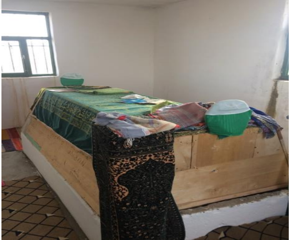
Foto.33: oban Dede Yatırının Sandukası (24.09.2016)