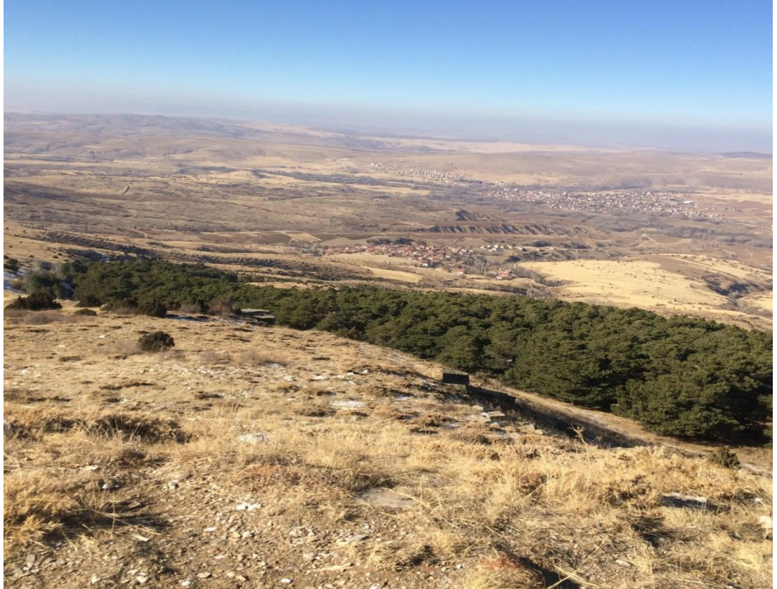
Foto.40: Turluhan Köyü Sıkdoruk Koruluđu (25.11.2016)