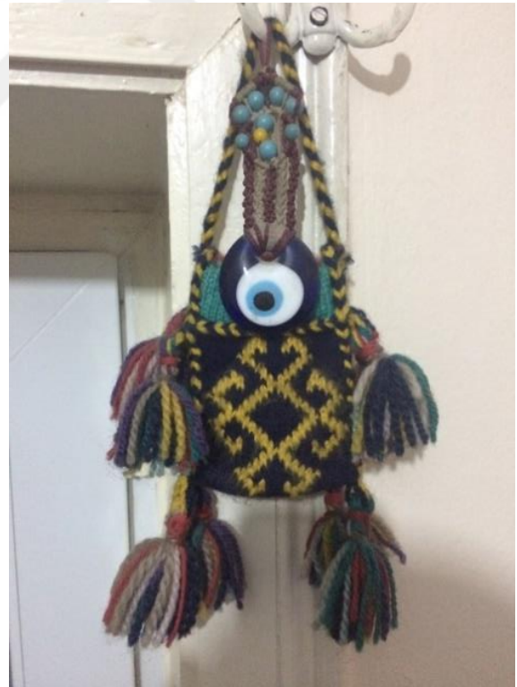
Foto.25: Kilim Motif Üstü Nazar Boncuğu (19.11.2016)