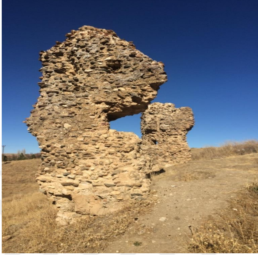
Foto-11: Tarihi Dikilitaş Sütunlarının Yan Görünümü (Çayralan/2017)