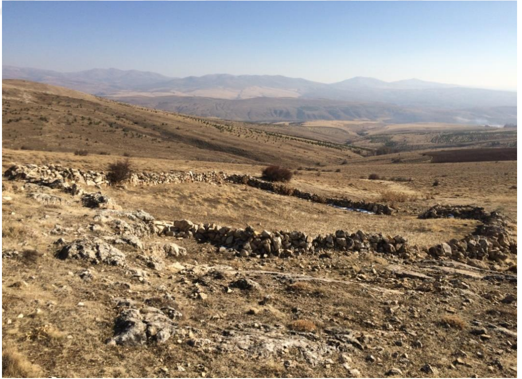
Foto.31: Gürpınar Abdal Dağı'nda Yer Alan Dede Mezarının Genel Görüntüsü ve Ardıç Ağaçları (22.10.2016)