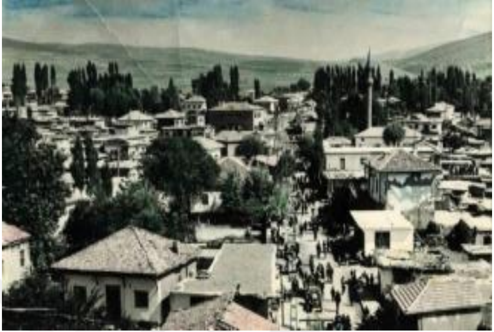
Foto.1: Çayıralan'ın 1921 Yılında Çekilmiş Görüntüsü. (09.02.2018) 67