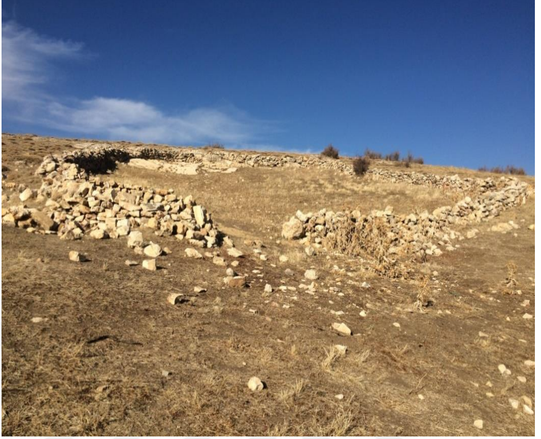
Foto.30: Gürpınar Abdal Dağında Yer Alan Dede Mezarı (22.10.2016)