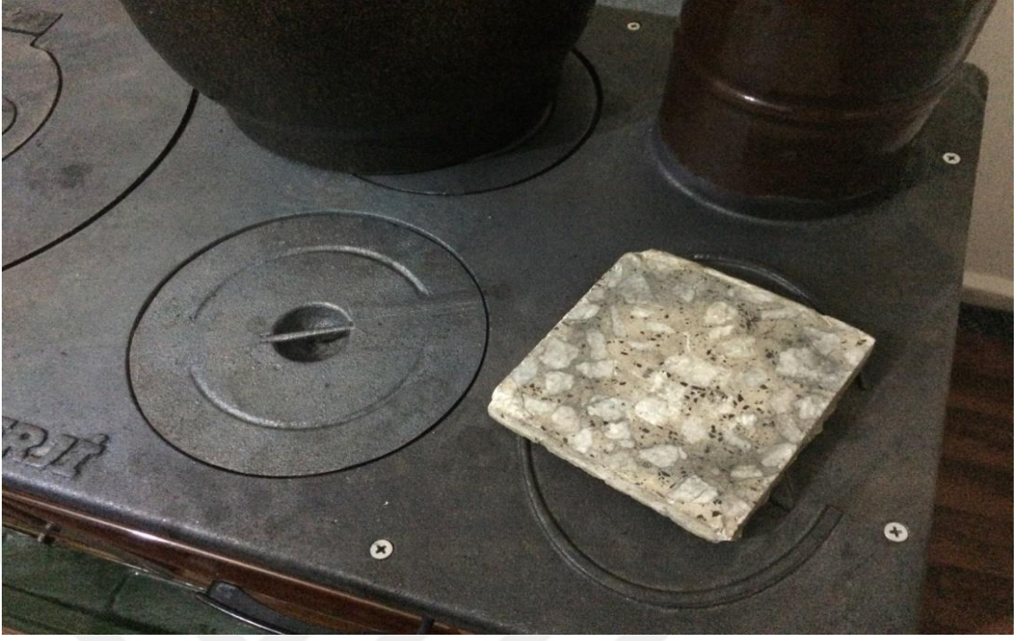
Foto.19: Soba Üzerinde Isıtılan Taş (08.10.2016)