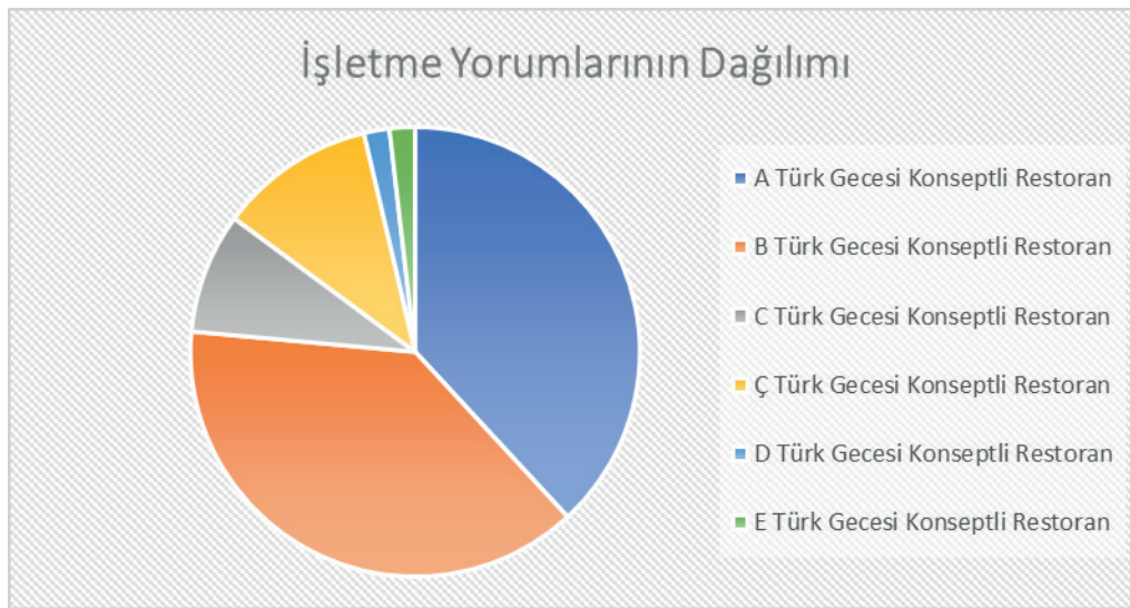
Grafik 1. Restoran Yorumlarının Yüzdeler Dağılımı

Tablo incelendiğinde, en çok olumlu-olumsuz yorumun B işletmesinin (410), en az olumlu-olumsuz yorumun ise D (20) ve E (20) işletmesine ait olduğu görülmektedir. Tabloya bakıldığında, A (407) ve B (410) işletmelerinin diğer işletmelere göre daha fazla olumlu-olumsuz yoruma sahiptir. Türk gecesi konseptli 6 restoranın yorumlarının betimsel analizi sonucunda yüzdeler oranlarına bakıldığında aşağıdaki grafik ortaya çıkmıştır.