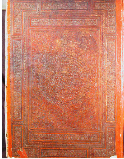
Foto 3: Kur'an-ı Kerim / cildin ön yüzü, 1314 tarihli (KMM 12-2) (Zeynep Demircan Aksoy'dan, XIV. Yüzyıl Anadolu Türk Tezhip...s. 117)

Benzer süsleme örneklerine kitap süsleme sanatlarında sıkça rastlanmaktadır. Özellikle cild kapağı süslemelerinde ana süsleme ögesi olan şemsenin, 14. yüzyıldan itibaren ve yoğun olarak 15. yüzyılda yuvarlakdan dilimli oval şekle geçtiği bilinmektedir. Dilimli oval oval şemseli çok sayıda cild kapağı tasarımı dönemin karakteristiğidir.