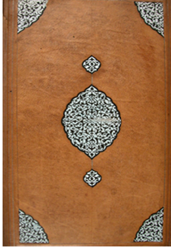
Foto 6: TSMK H.781 numarada kayıtlı Hamse-i Nizâmi adlı eserin Herat'ta yapılmış cildinin iç kapağı, 1445-1446.