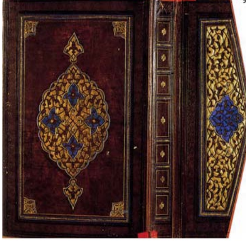
Foto 8: TSMK H.781 numarada kayıtlı Hamse-i Nizâmi adlı eserin 1445-1446 tarihleri arasında Herat'ta yapılmış cildi.