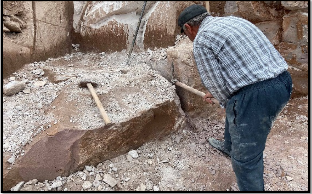
Görsel 4.2: Kazma ile Kayanın Açılması

giderdik. O zamanlarda bir atımız vardı. At arabasıyla ocağa giderdik.” (Kişisel Görüşme, İsmail Yıldız, 2022). Yıldız, sabah erken saatlerde kalkıp dönemin ulaşım aracı olan at arabasıyla ocağa gittiklerini belirtmektedir. Taşı çıkarmak için bilek gücüne ihtiyaç duyulmaktadır (Görsel 4.2).