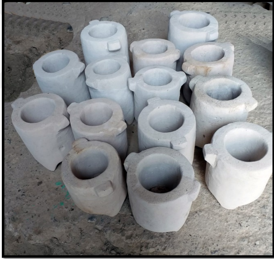
Görsel 4.19: Küçük ve Orta Dorak Taşları

üretiminde İsmail Yıldız'ı en zorlayanlarının küçük Dorak Taşları olduğunu belirtmektedir. Küçük taşların şekil verme sürecinde yerinden oynama, sabit durmama gibi durumları ustanın işini zorlaştırmaktadır (Kişisel Görüşme, İsmail Yıldız, 2022). Küçük Dorak Taşlarını iki veya üç günde, orta Dorak Taşlarını da beş gün gibi bir zaman diliminde üretmektedir (Görsel 4.19).