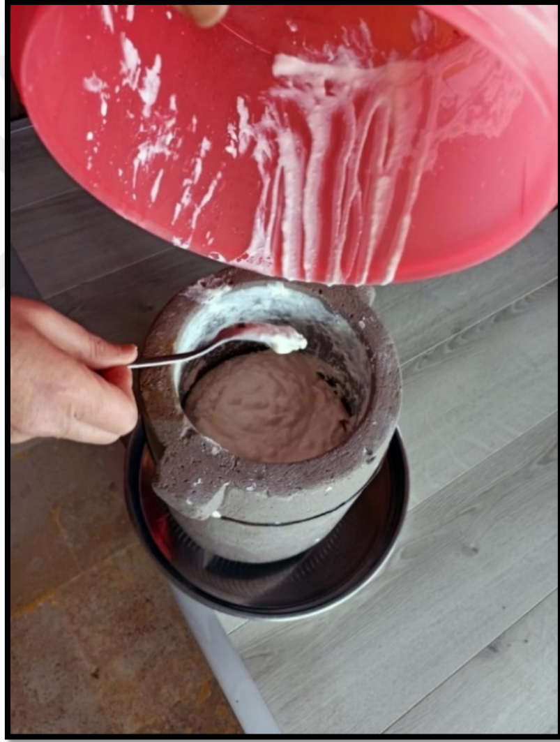
Görsel 4.203: Dorak Taşına Yoğurt Konulması (Özsoy, 2022).

üzerine biraz saf tuz ilave edilir (Görsel 4.20). Taşa her yoğurt konulmasında tekrar yoğurt üzerine tuz ilave edilmektedir. Yoğurt tuz şeklinde devam eden bir süreçtir.