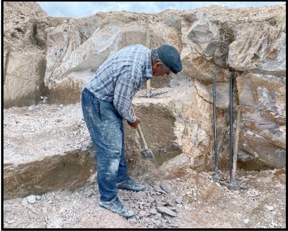
Görsel 4.5: Kaya Yüzeyine Balyoz ile Çivi Çakılma İşlemi