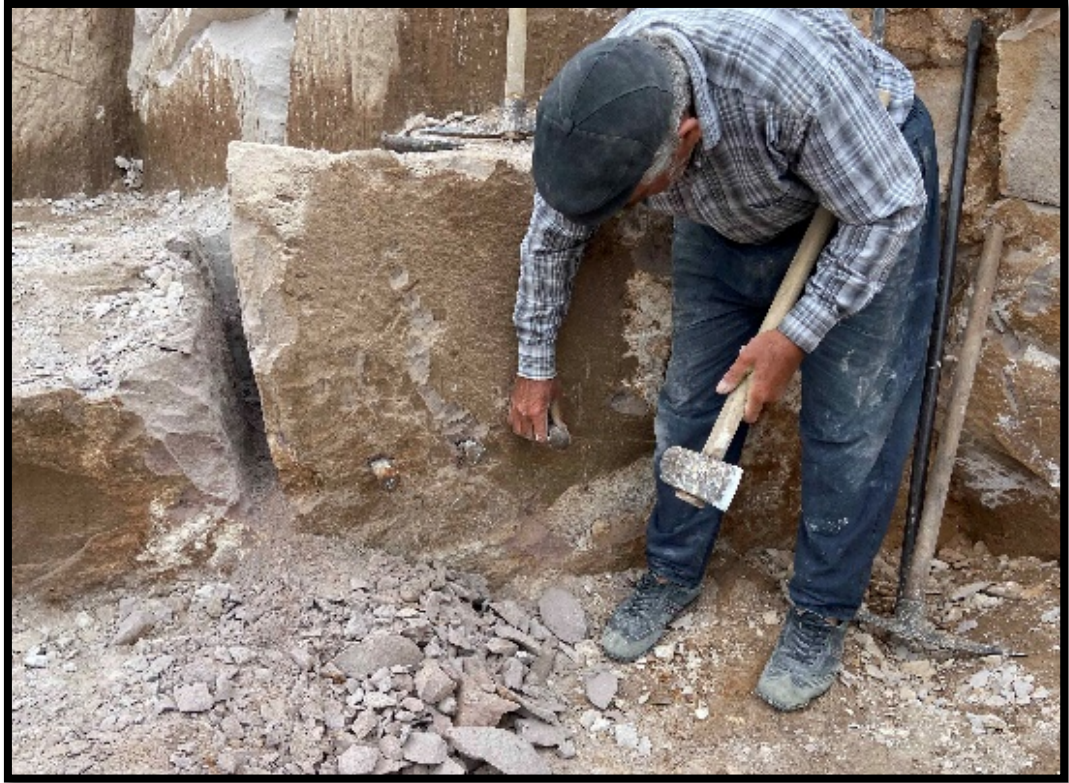
Grsel 4.4: Balyoz ile ivi akılma İřlemi

bir şekilde akılmaları gerekmektedir. ünkü kayanın yerinden oynatılması iin belli aralıklarla paralara ayrılması saėlanmalıdır. ivi akılma iřlemi gerekleřtirildikten sonra kayadan tařın paralar halinde sklmesi gereklidir. Bunun iin tekrar manivela kullanılarak ivilerin yerlerinde derinlik oluřturması beklenir.