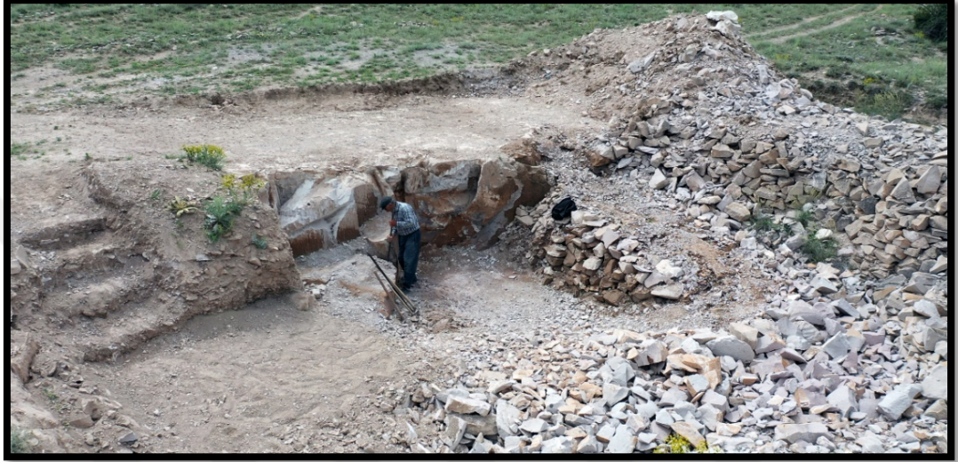
Görsel 4.1: Dorak Taş Ocağı

Taş ocağından taşın çıkarma için önce bir damar açılır. Bu damar sayesinde taşlar çeşitli el aletleri kullanılarak kesilmeye başlanır.