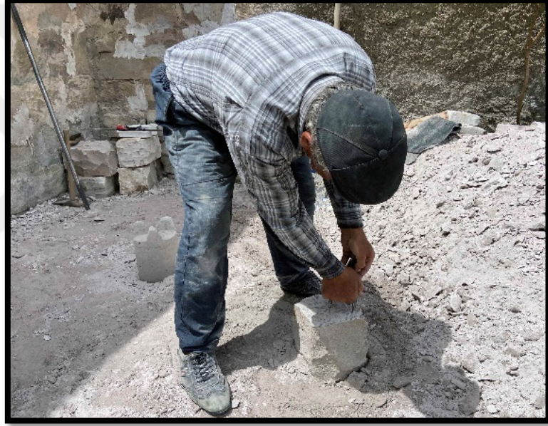
Görsel 4.9: Pergel ile Daire Çizimi

Tarak yardımıyla yüzeyi temizlenen taş, daha sonra pergel adı verilen alet yardımıyla düzleştirilen yüzey kısmına daire çizilme işlemine geçilir. Burada kullanılan pergel aletinin iki ucu da sivridir. Pergelin bir ucu taşın orta noktasına sabitlenir. Diğer ucuyla da taş yüzeyine daire çizilmeye başlanır (Görsel 4.9).