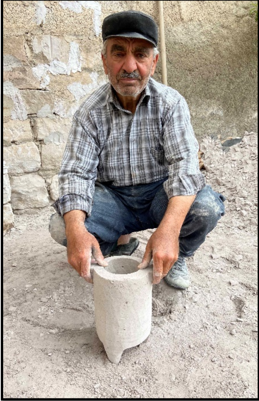
Görsel 4.17: Üretimi Tamamlanan Dorak Taşı