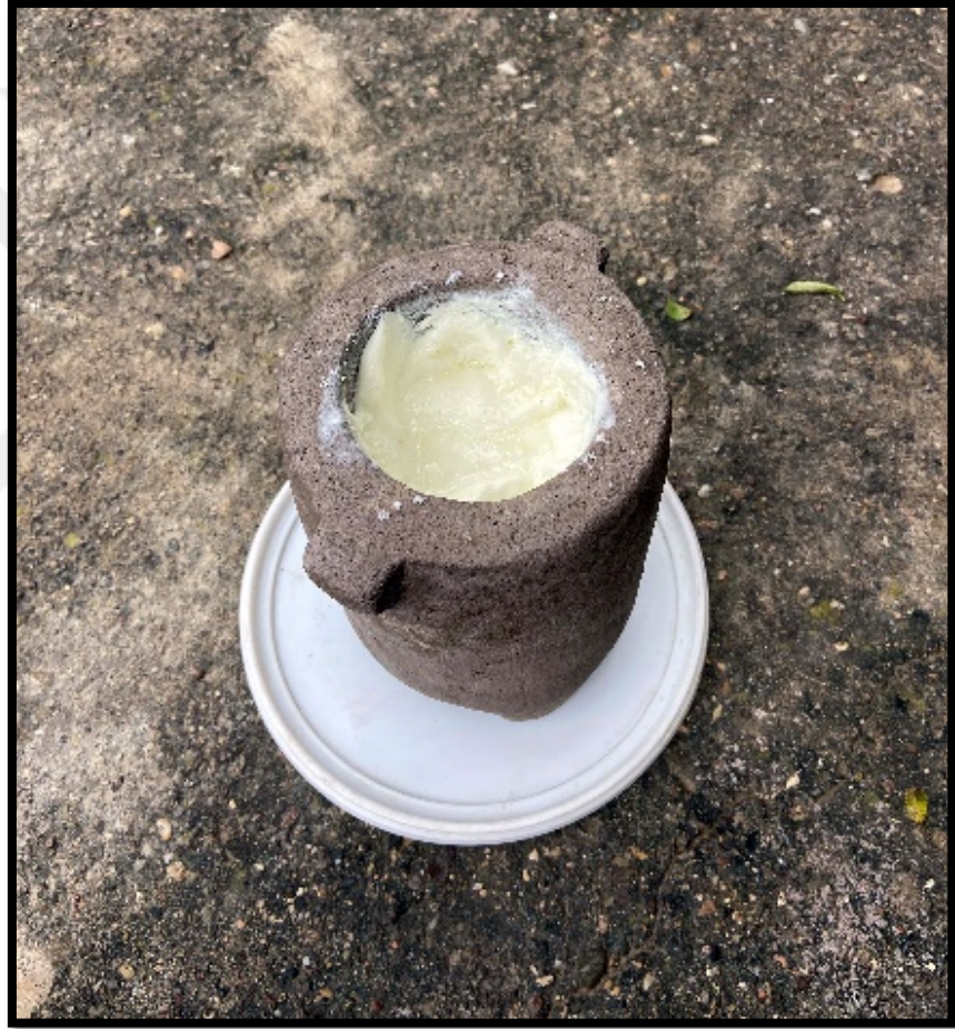
Görsel 4.21: Dorak Taşının Yoğurt Süzme Aşaması

Dorak Taşı çok kısa bir süre sonra yoğurdun suyunu süzer. Bu şekilde Dorak Yoğurdu elde edilmiş olur (Görsel 4.21).