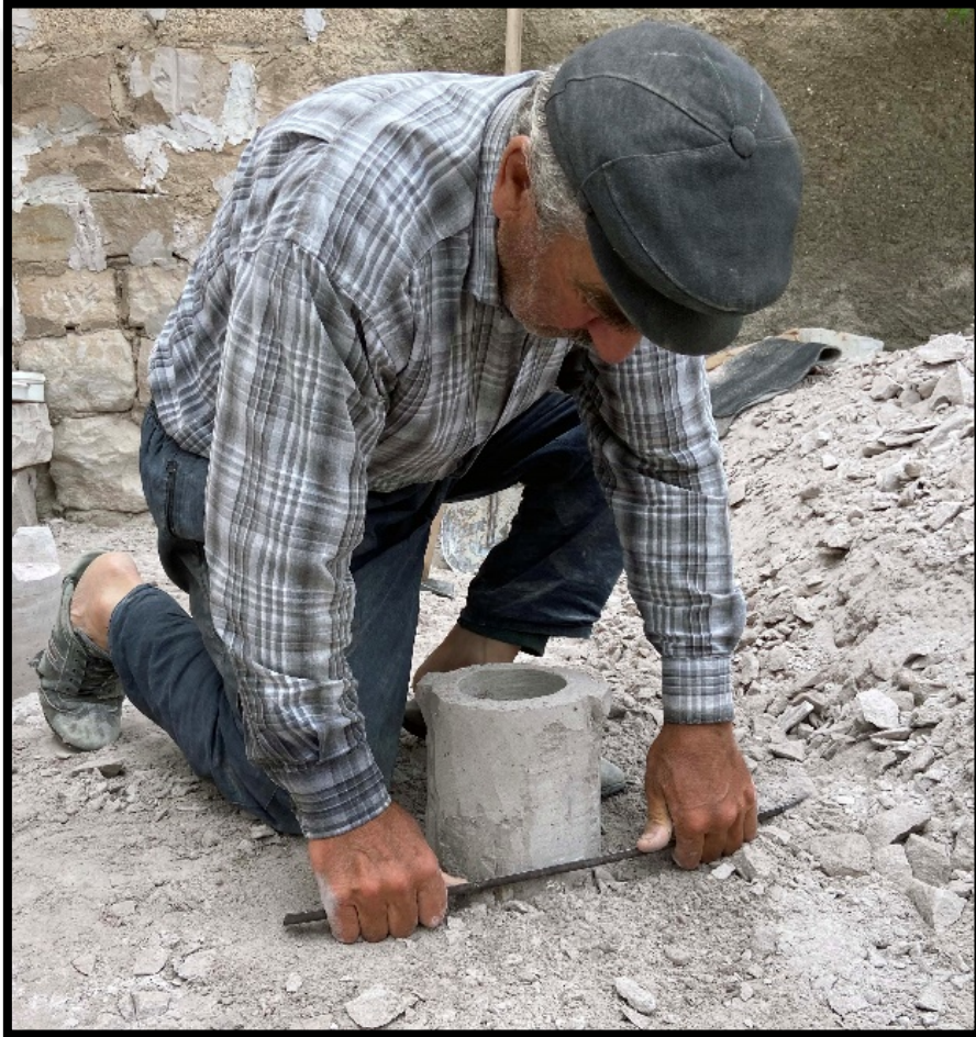
Görsel 1.13: Tırpan Aletinin Kullanımı

Püsek ile dış kısmı yontulan Dorak Taşının çevresi tırpan yardımıyla pürüzlerinden arındırılır (Görsel 4.13). Eskiden köylerde ekin, ot biçiminde kullanılan tırpan parçaları burada Dorak Taşının iç ve dış kısımlarının yapımın kullanılmaktadır.