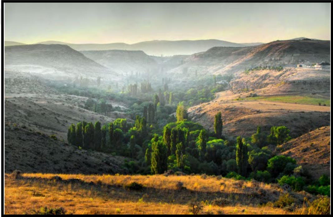
Görsel 3.1 : Koramaz Vadisi Genel Görünümü (Kural, 2020).

Bu deęerler aısından Koramaz Vadisi listede Őu Őekilde tanıtılmaktadır; Kayseri ili Melikgazi ile sınırlarında bulunan Koramaz Vadisi, Kayseri Őehir merkezine 20 km uzaklıktadır. Vadi doęudan batı istikametine doęru 12 km uzunluęundaki deprem kırığı sonucu oluŐmuŐtur (Görsel-3.1).