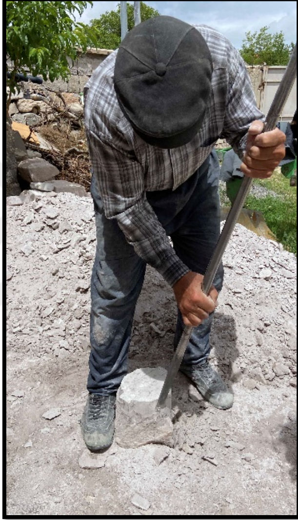
Görsel 4.11: Püsek ile Dorak Taşının Dış Kısmının Yontulması

Bu işlem yapılırken Dorak Taşının kulpları da ortaya çıkarılır. Küçük Dorak Taşlarında iki kulp, büyük Doraklar da ise dört kulp bulunmaktadır. Ayrıca taş yüzeyine pergel ile çizilen dairenin iç kısmı püsek ile oyulmaya başlanır. Bu şekilde