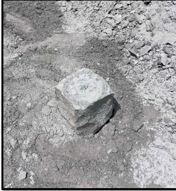
Görsel 4.10: Yüzeyine Pergel ile Daire Çizilen Taş

Taşın el işçiliği ile şekil almasında fire verilmesinin önüne geçilmiş olmaktadır. Eğer bu işlemlerin fabrikasyon olarak seri üretiminin yapılması söz konusu olsa fire verme olasılığının daha fazla olması beklenmektedir. Bu durumu İsmail Yıldız şöyle ifade etmektedir; “ Taşı el işçiliği ile şekil verince fire önleniyor. Makine olsa fire verir ” (Kişisel Görüşme, İsmail Yıldız, 2022).