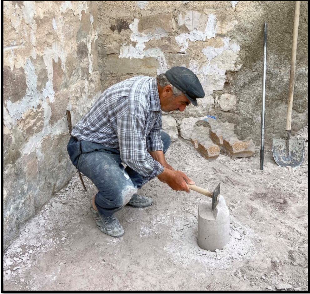
Görsel 4.24: Dorak Taşı Ayaklarının Yapımı

Tarak aletinin kullanımdan sonra Dorak Taşı ayaklarının pürüzlü kısımlarının alınmasında tırpan aleti kullanılmaktadır (Görsel 4.15).