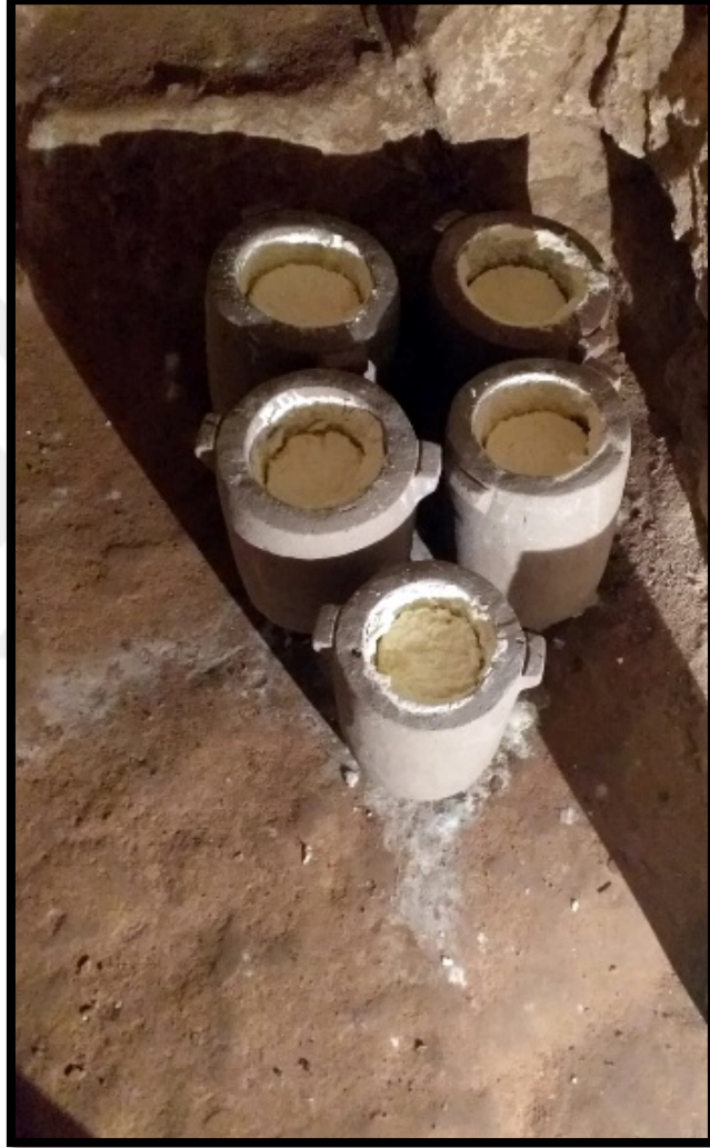
Görsel 4.22: Koramaz Vadisi Mağaralarında Saklanan Dorak Yoğurtları

İçi yoğurt olan Dorak Taşının üzerine ince bir tülbent, bez ya da küçük bir sini gibi bir malzemeyle üzeri kapatılmaktadır (Görsel 4.23). Amaç üzerine herhangi bir şeyin düşmesini önlemektir. Ayrıca kimi zaman bez ile ağız kısmı kapatılan Dorak Taşının iç kısmına ağırlık yapması için bastırma taşı konur. İnce yassı ve Dorak Taşının