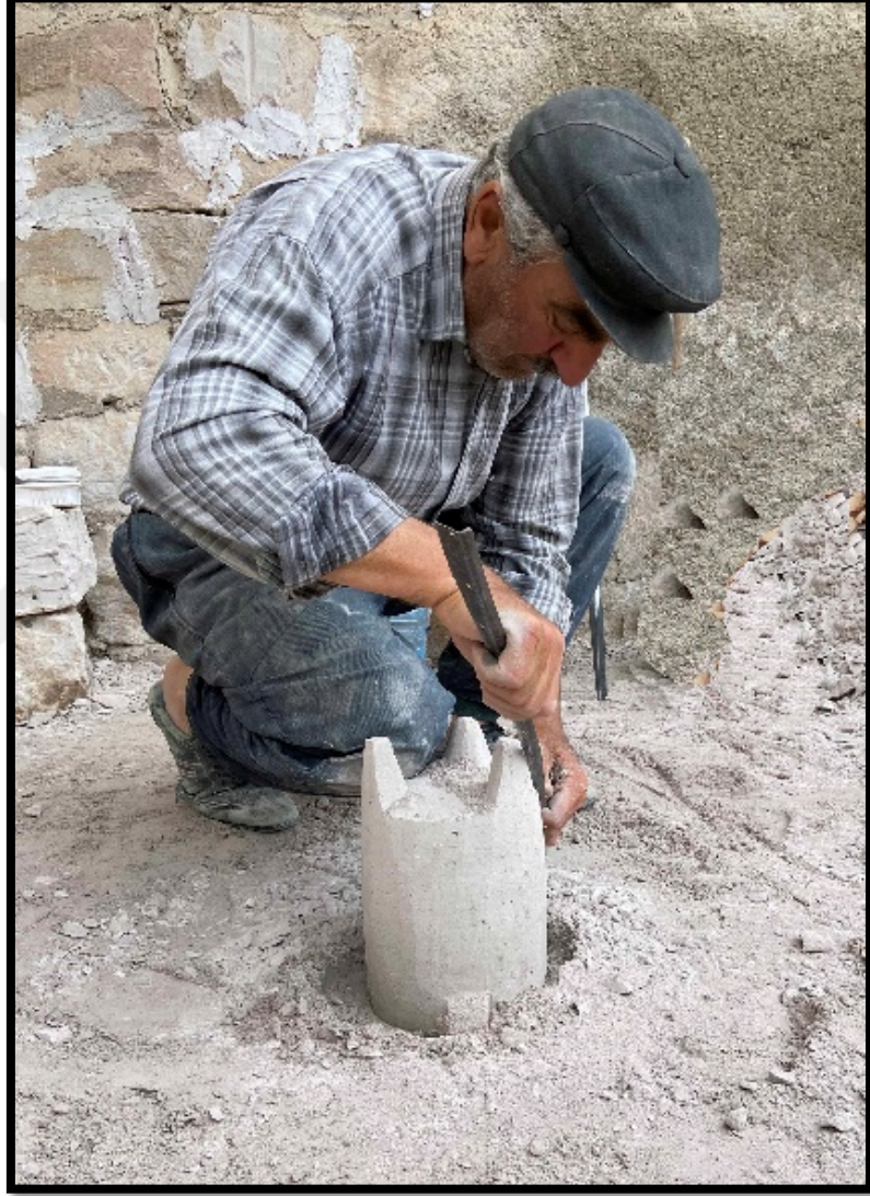
Görsel 4.15: Tırpan Aleti ile Dorak Taşı Ayaklarının Yapımı

Dorak Taşının ayaklarının yapımından sonra taşın iç ve dış kısımları kalın telli fırça yardımıyla temizlenmektedir (Görsel 4.16).