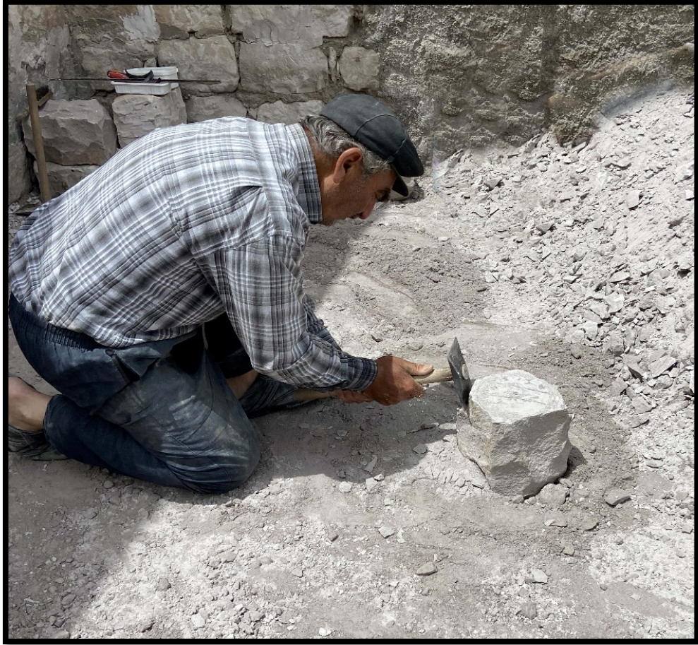
Görsel 4.8: Tarak Aleti ile Tařın Yüzeyinin Düzlenmesi

Zemine yerleřtirilen tařın řekli dikdörtgen görünümündedir. Tařın yere sabitleme iřleminden sonra üst yüzeyi tarak adı verilen alet ile düzlenir (Görsel 4.8). Tarak aleti yaklaşık 50 cm uzunluęundaki tahta sapı kullanılarak tařın yüzeyinde iřlem yapılmaya başlanır. Tarak aletinin uç kısımları düz ve demirden yapılmıřtır. Tarak aleti yardımıyla tařa uygulanan kuvvet sayesinde tařın üst kısmı düz olmaya başlar. Bu iřlem ustanın el mahareti sayesinde 2-3 dakikada gerekleřtirilmektedir.