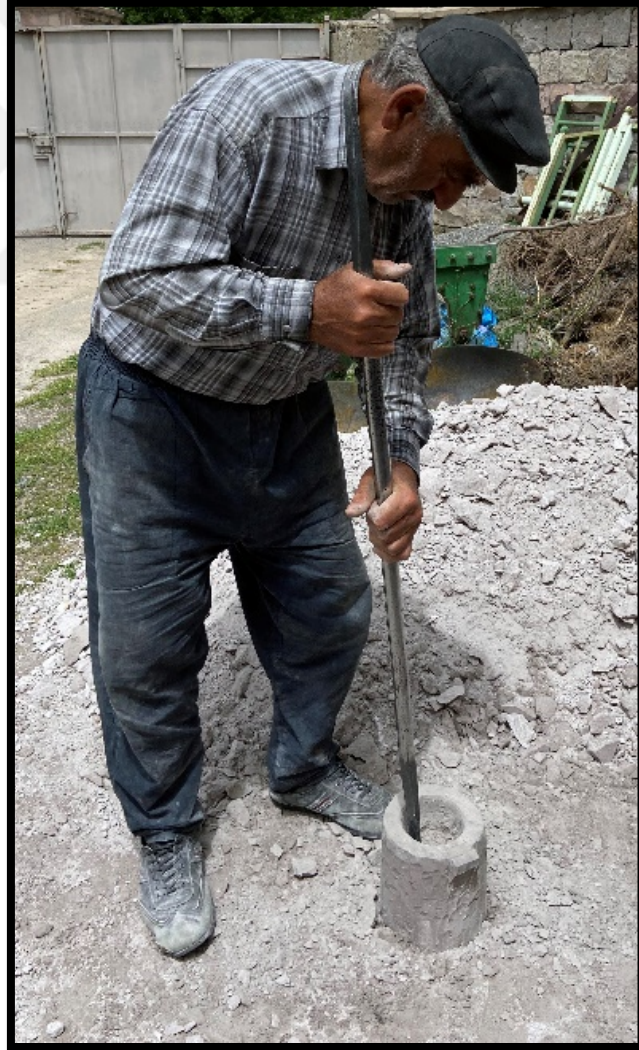
Görsel 4.12: Püsek ile Dorak Taşının İç Kısmının Oyulması

taşın iç kısmı oluşturulur (Görsel 4.12). Taşın iç kısmı yoğurt konulan bölümdür. Buranın oyulması püsek ile sağlanır. Yeteri derinliğe ulaşıncaya kadar bu işlem yapılır. Derinliğin sağlanmasında ustanın el yardımı ve göz kararıyla taşın derinlik ve kalınlık kısımları ayarlanmış olur. Bu işlemin yapılma süresi ise ustanın maharetliliği sayesinde uzun sürmemektedir.