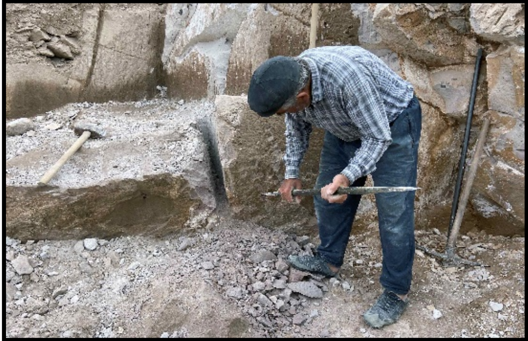
Görsel 4.3: Manivela ile Kaya Oyulma İşlemi

Kayadan taş çıkarma işleminde ilk önce kazma kullanılarak yer açılır. Kayanın bir bölgesine manivela yardımıyla kuvvet uygulanır. Burada amaç manivela yardımıyla çivi yeri açılmasını sağlamaktır. Daha sonra kaya yüzeyine çivi çakılması için manivela aletiyle kaya yüzeyi oyulur (Görsel 4.3).