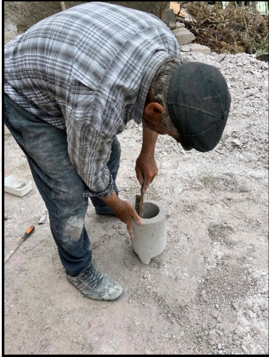
Görsel 4.16: Fırça Kullanımı

Son olarak fırça ile temizlenmesi biten Dorak Taşının üretim aşamaları tamamlanmış olur. Bazı durumlardan Dorak Taşının yüzeylerinde gözenekler oluşabilir. Bunun