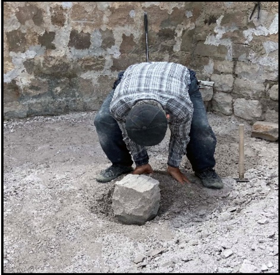
Görsel 4.7: Dorak Taşları ve Zemin Ayarlama İşlemi

Taş ocağından getirilen taşın işlenme aşamasında ilk iş taşın yerinin ayarlanmasıdır. Amaç burada küçük taşların işlenmesindeki zorluğu ortadan kaldırmaktır. Çünkü küçük taşlar işlem görürken sabit durmamaktadır. Buda üretimin güç olmasına neden olmaktadır. Daha hızlı ve verimli bir şekilde küçük ebattaki taşlardan üretim yapabilmek için taşın yeri sabitlenmelidir. Bunun için taşın boyutuna göre zeminde çukur oluşturulur ve taşın etrafı çukurun toprağı ile kaplanır (Görsel 4.7).