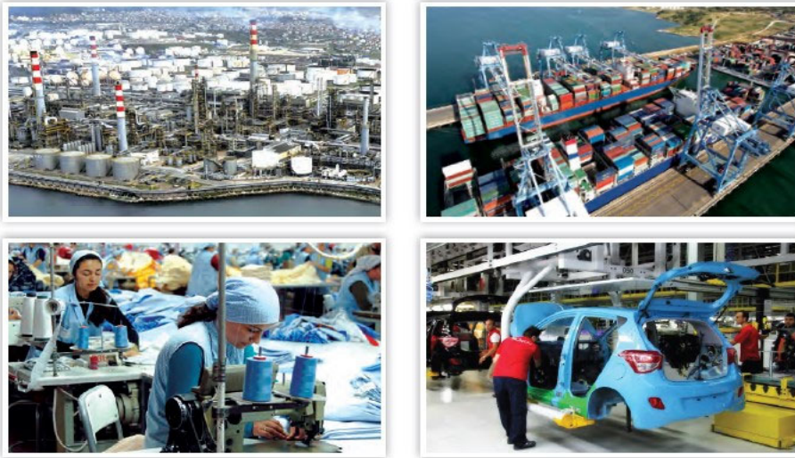
Görsel 5.6: İzmit, sanayi ve ticaret faaliyetlerinin yoğun olduğu bir ilimizdir.

Görüşülen sınıf öğretmenlerinden “Kitaptaki görsellerin ilgi çekiciliği ve merak uyandırıcılığı hakkındaki düşünceleriniz nelerdir?” sorusuna örnek vermeleri istenmiş ve öğretmenler aşağıdaki sayfaları örnek olarak belirtmişler.