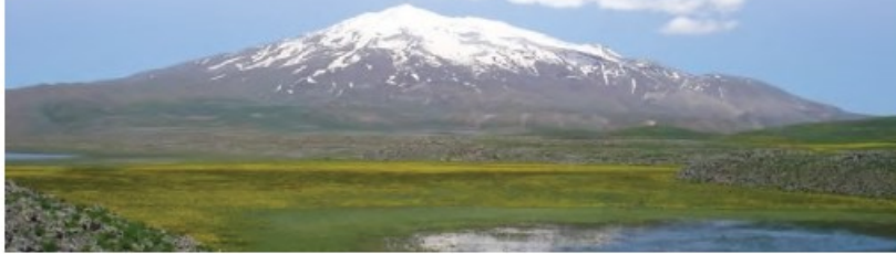
Görsel 3.5: Süphan Dağı’ndan bir görünüm

Halkın anlattığına göre teknenin bazı parçaları hâlâ dağın tepesinde durmaktadır. (1)