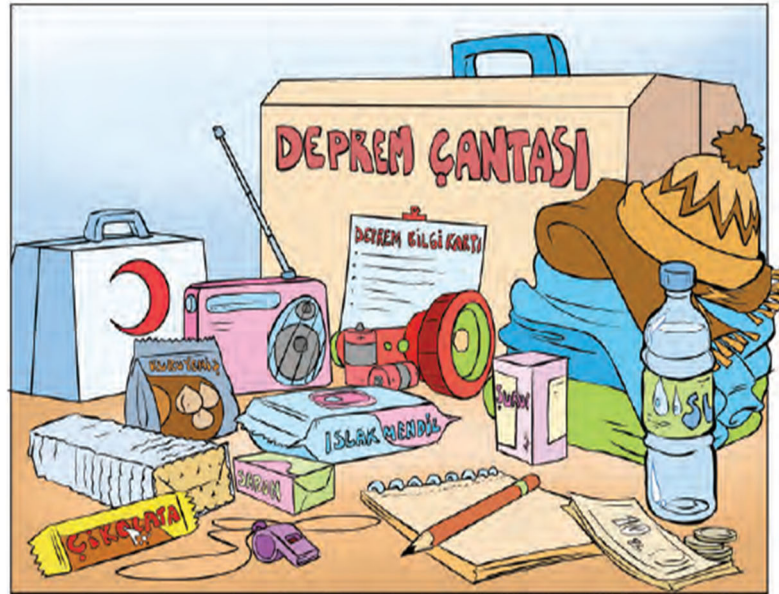
Görsel 3.10: Deprem çantasında bulunması gerekenler

Sınıf öğretmenlerinden “Kitaptaki görsellerin başlıklarının içerikle uyumu ile ilgili düşünceleriniz nelerdir? Açıklar mısınız?” sorusuna örnek vermeleri istenmiş ve öğretmenler aşağıdaki sayfaları örnek olarak belirtmişlerdir.