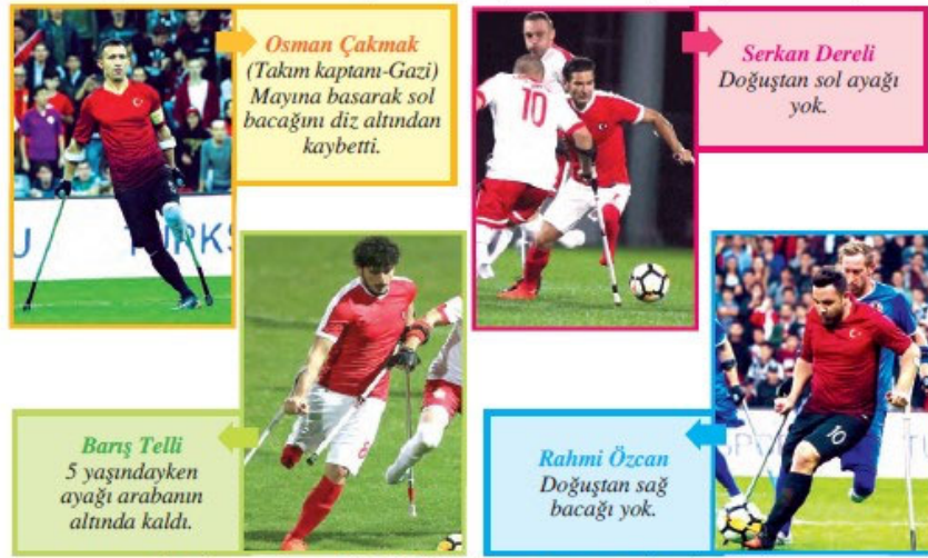
Görsel 1.14: Ampute Futbol Milli Takımımızın oyuncularından bazıları

Sınıf öğretmenlerinden “Kitaptaki görsellerin öğrencilerin zihinsel gelişimine uygunluğu ile ilgili düşünceleriniz nelerdir? Açıklar mısınız?” sorusuna örnek vermeleri istenmiş ve öğretmenler aşağıdaki sayfaları örnek olarak belirtmişler.